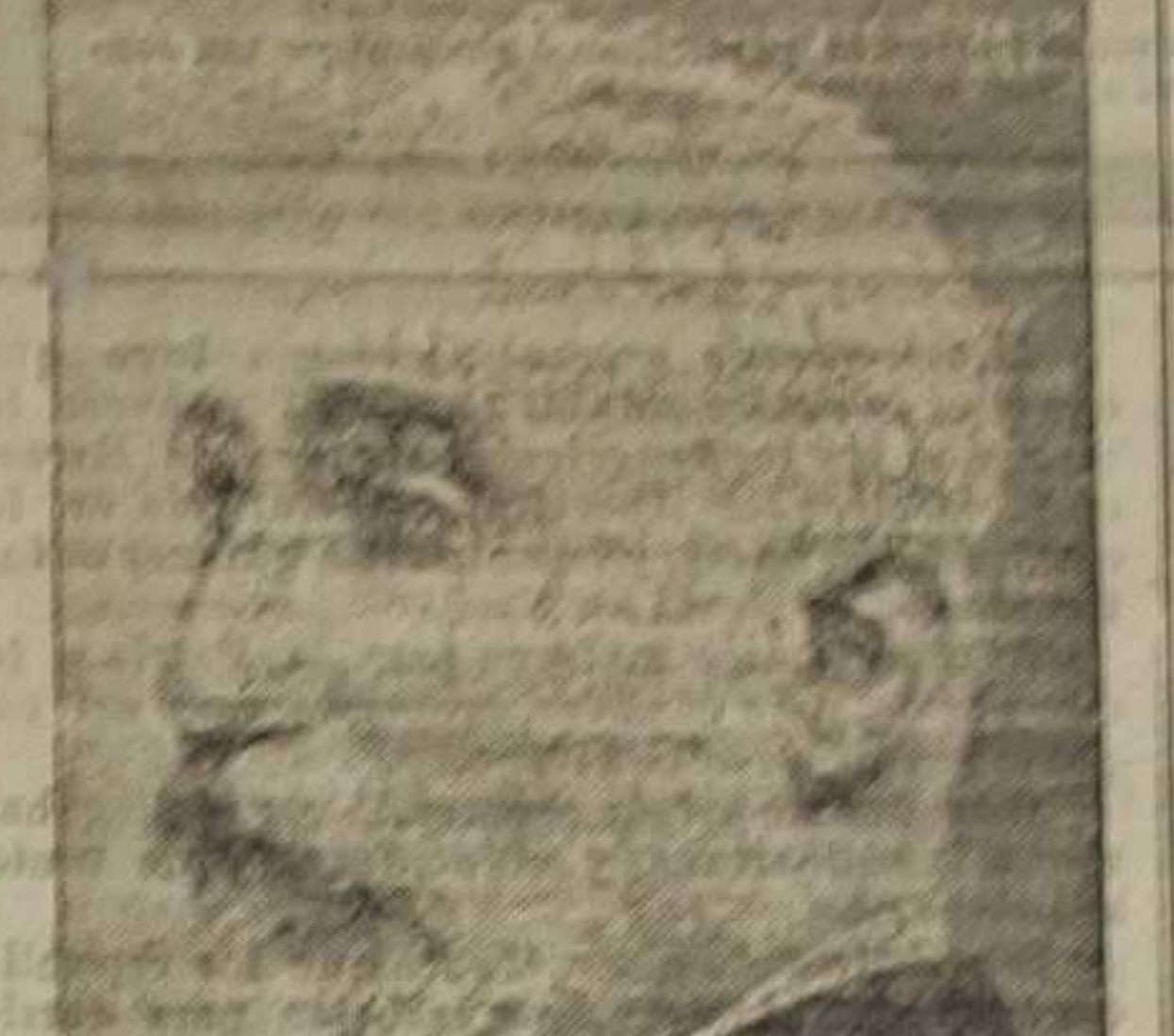
D. Antonio Maura Montaner