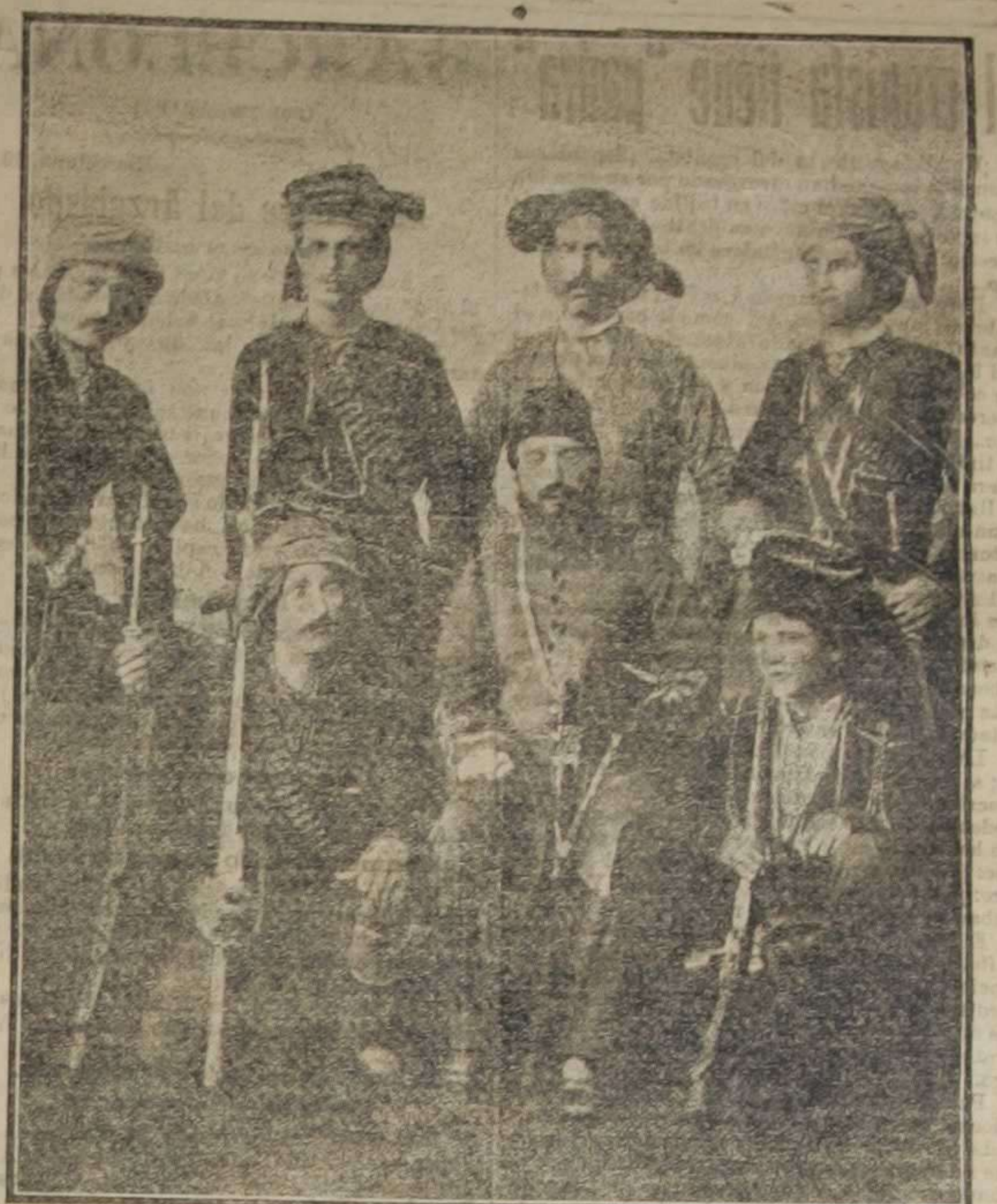
Grupo de Jefes y oficiales de las fuerzas turcas en Trípolitania

He aquí algunas noticias sobre Trípoli, la provincia turca africana de que pretende apoderarse Italia para hacer su primera colonia en esta tierra de África. objeto hoy de la ambición de las naciones europeas, y cuya parte Norte sería española si se hubiera continuado la política política que inició la casa de Austria y no hubiera desaparecido del Estado español el espíritu tradicional que formó nuestra nacionalidad y creó el mayor imperio que ha existido bajo el sol.