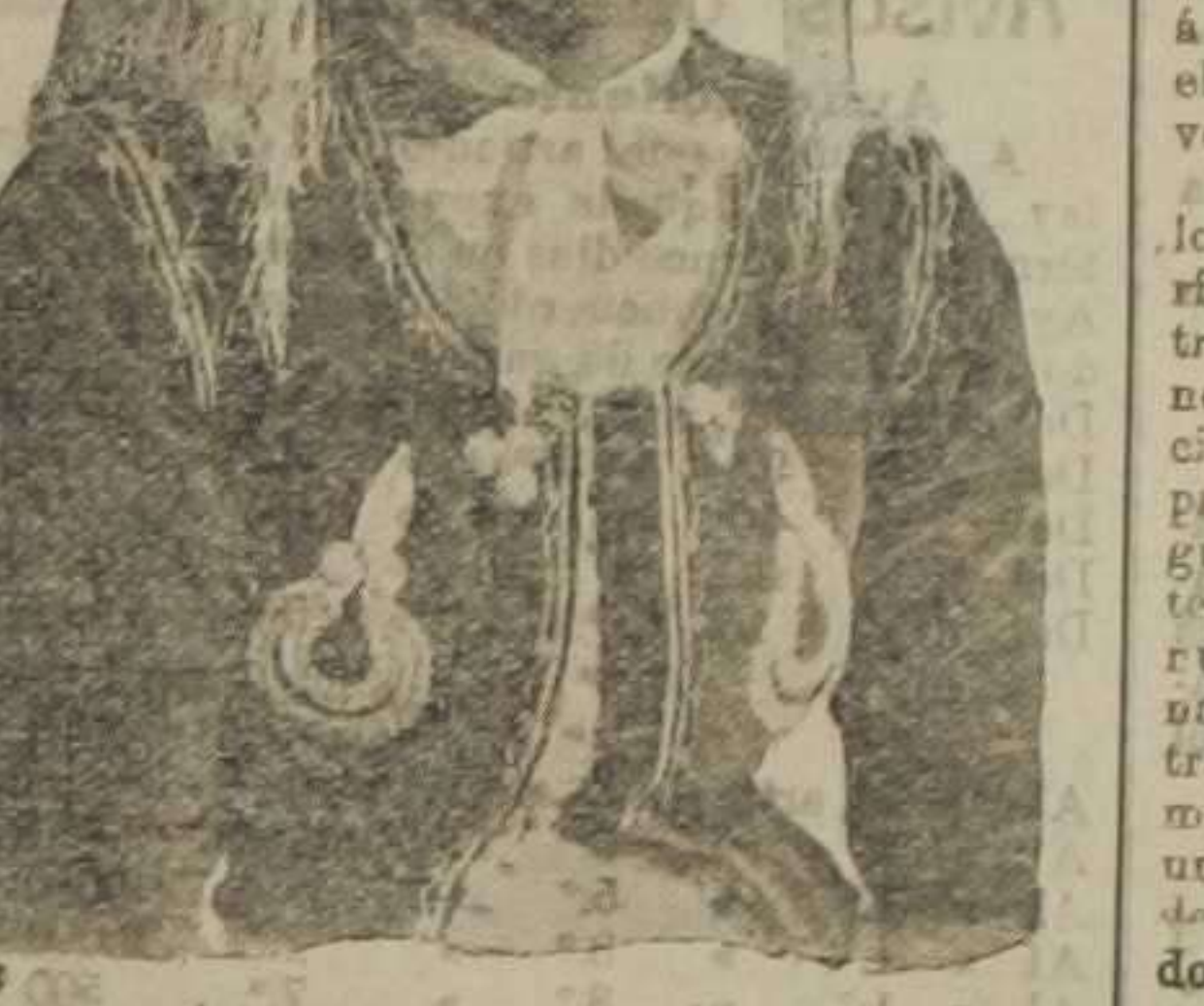
Tipo de mujer tripolitana

Claro está que podría devolverse su antiguo esplendor con grandes trabajos de restauración y abono de tierras, repoblación de bosques y alumbramiento y conducción de aguas, secundados por obras públicas de todo género, y eso parece se propone hacer Italia si logra apoderarse de esa región, á la que proyecta dirigir