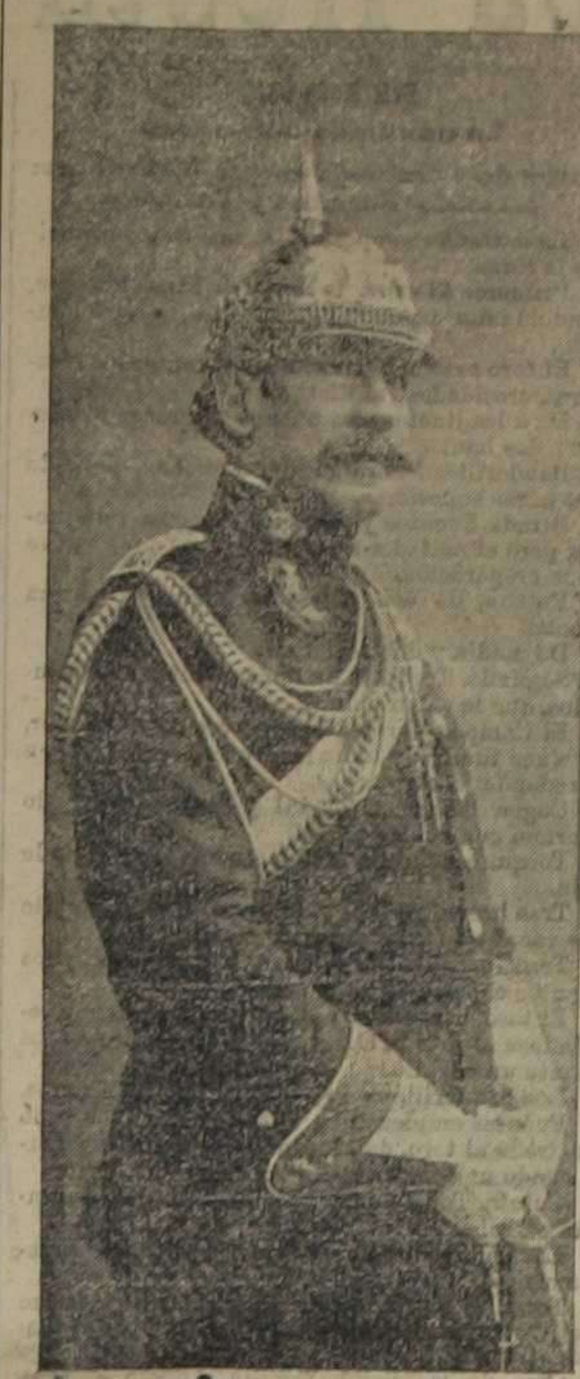
Excmo. Sr. D. Ramón Echagüe y Méndez-Vigo, conde del Serralto, capitán general de Valencia.

Según de público se decía, entre los detenidos figuran los principales promovedores de aquellos turbulentos sucesos. En el mixto de Madrid llegaron también 18 sujetos de Alcira detenidos como complicados en los sucesos desarrollados en la hermosa ciudad alcaireña.