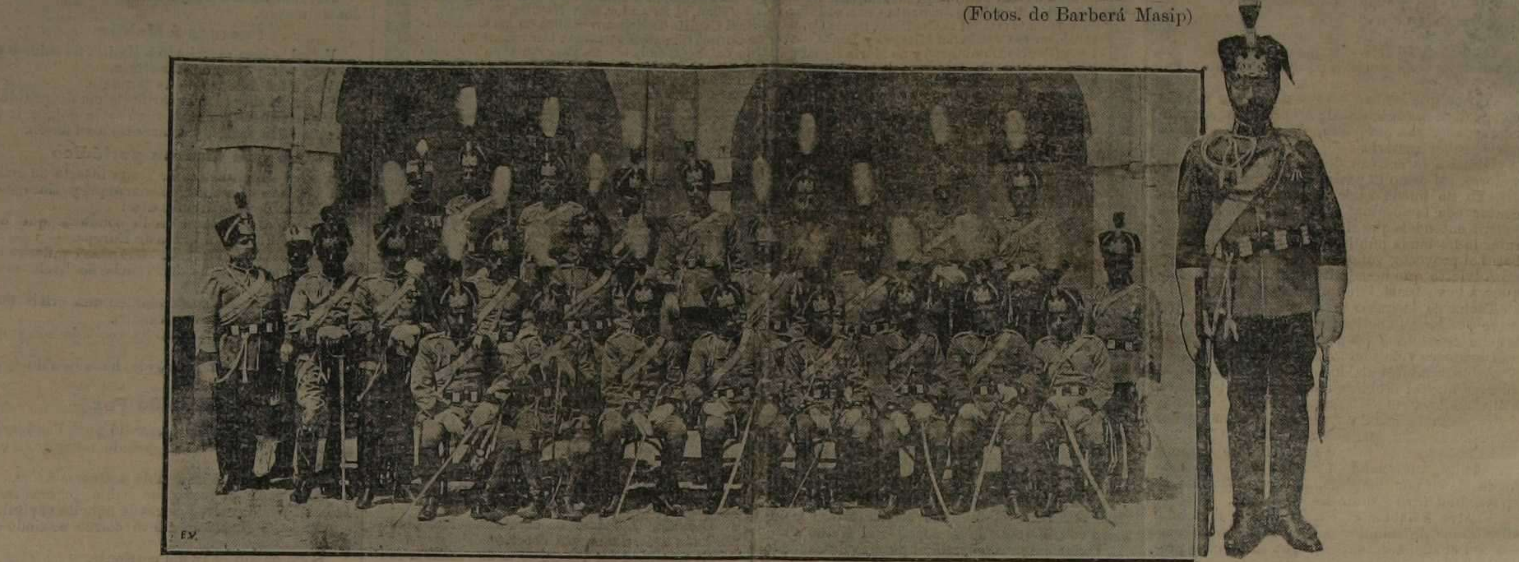
Lo que más llamó la atención fué el nuevo uniforme que usaban los jefes, oficiales y tropa del regimiento de caballería de Sesma, ahora Victoria Eugenia.

Regimiento de caballería, cazadores de Victoria Eugenia, cuyo nuevo uniforme vistió ayer por primera vez. (Grupo de jefes y oficiales.—Tipo de batidor)