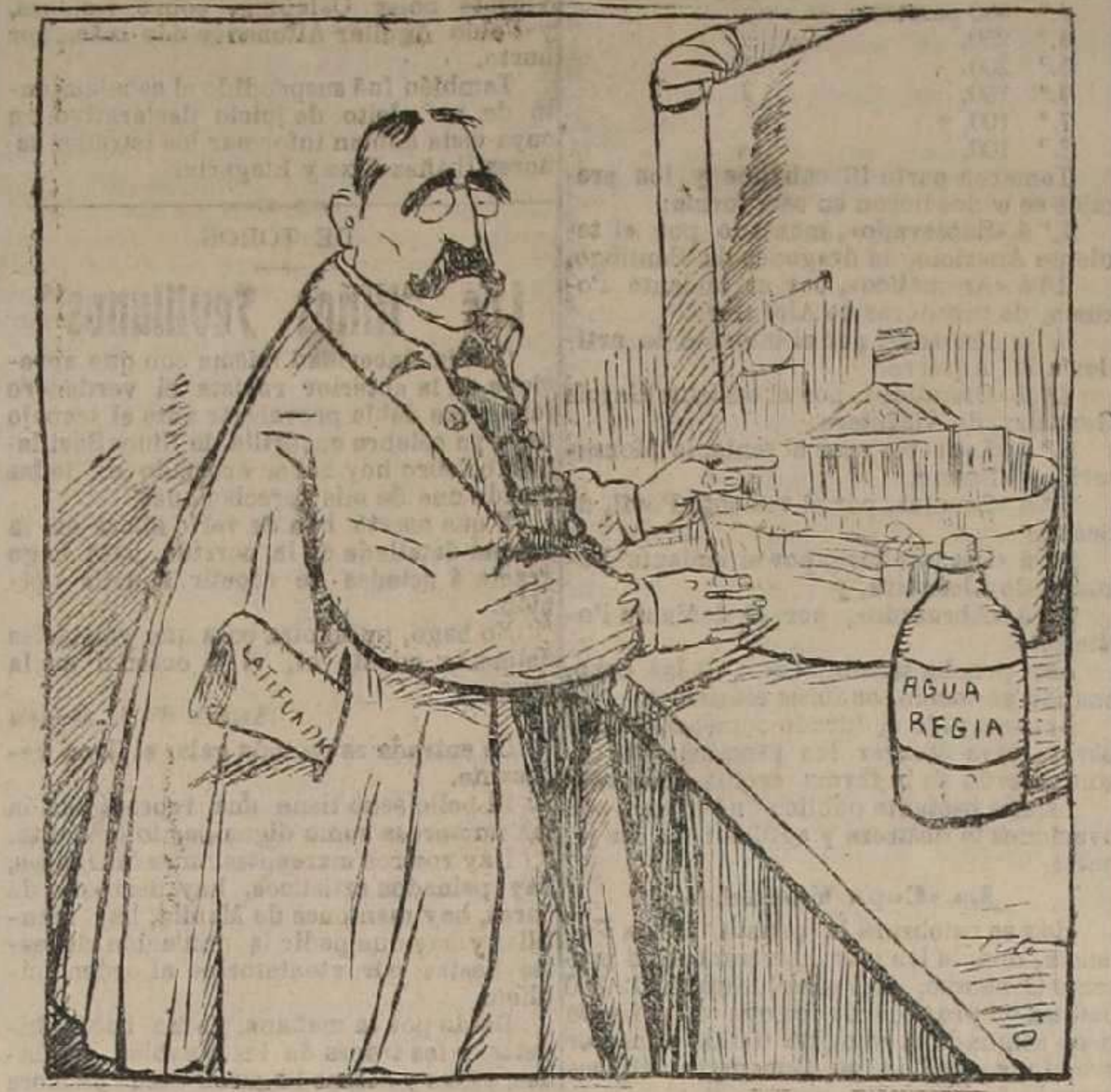
Todas las combinaciones me salen mal. ¿Será efecto del agua que estará corrompida?