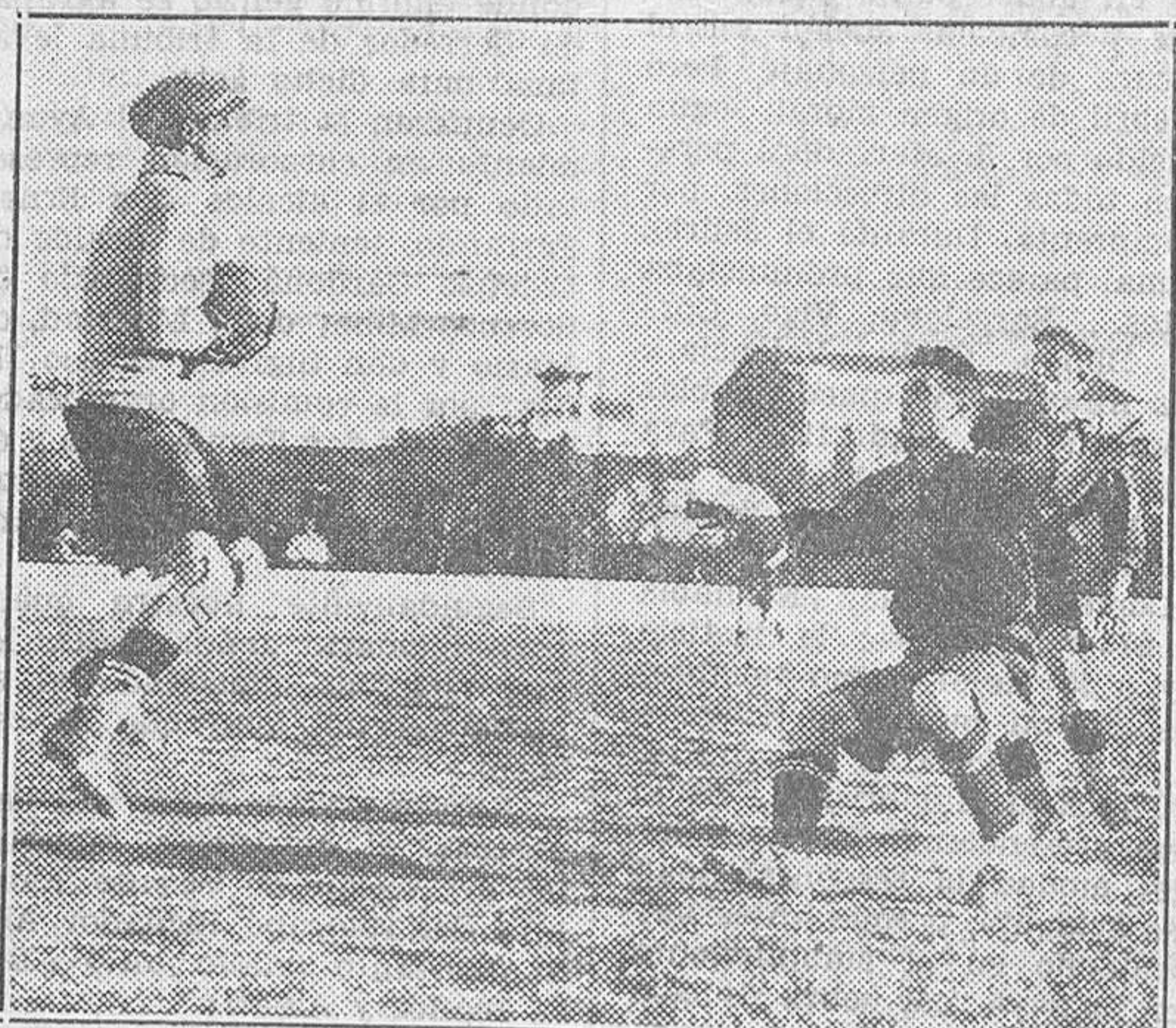
El portero del Levante resuelve una difícil situación para su marco con esta parada impresionante