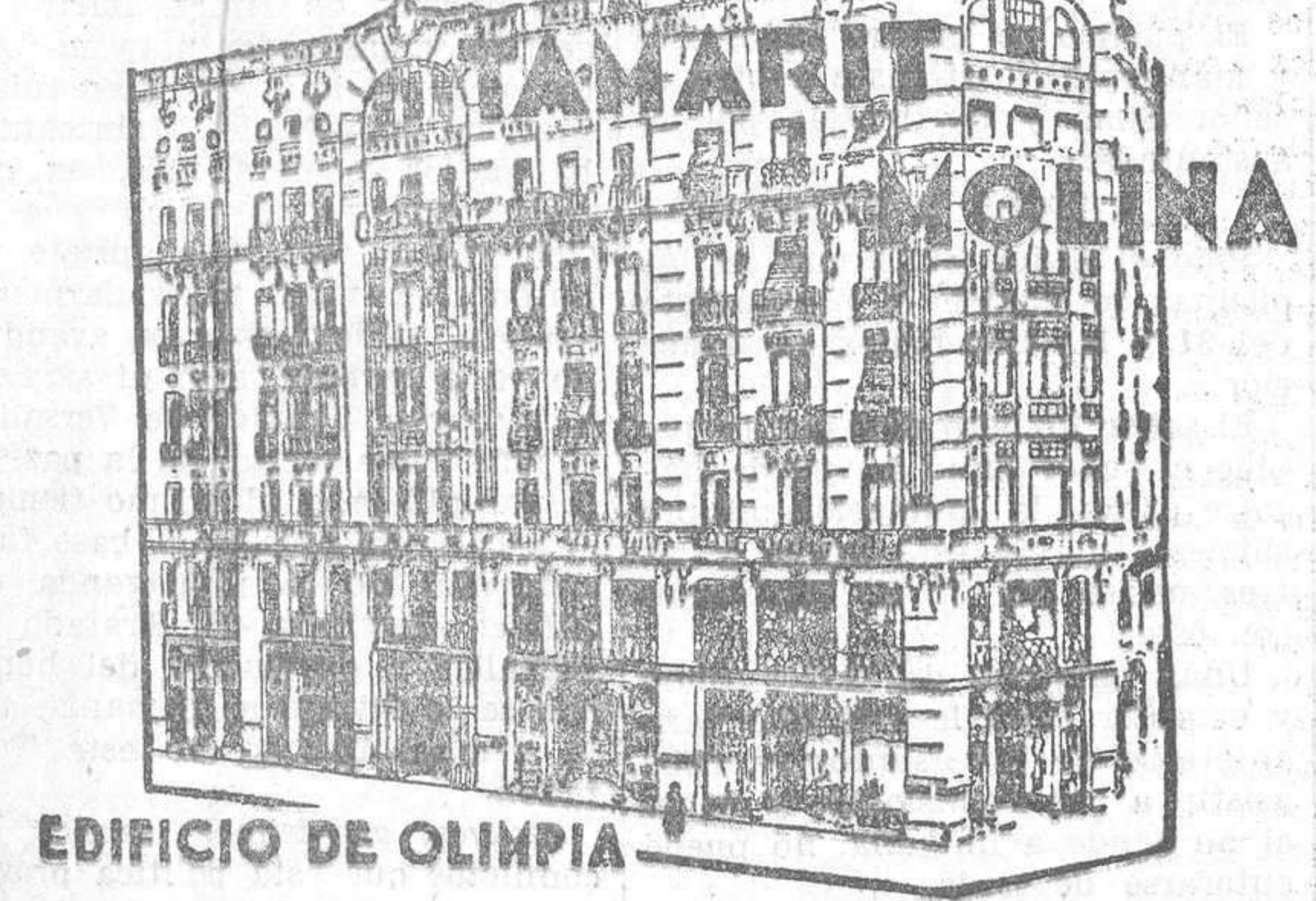
EDIFICIO DE OLIMPIA GARRIGUES, 2 Y 4 VALENCIA

Camas metálicas muebles de todas clases pianolas y rollos musica cochecitos para niños VICENTE