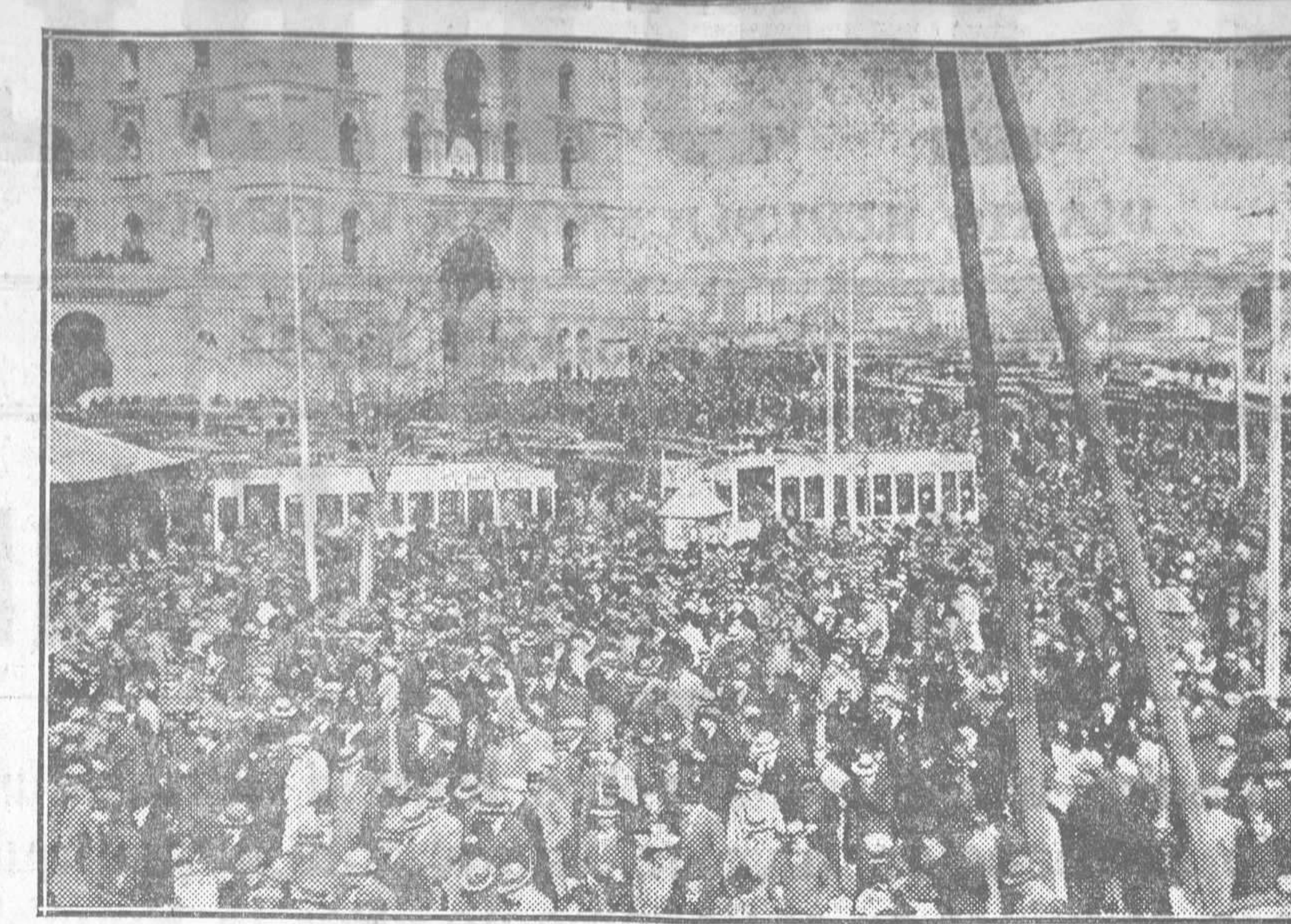
EL PUBLICO DESFILANDO LUEGO DE TERMINADO EL ACTO

Podrá decirse que yo callé en San Sebastián. Yo fui el iniciador y el promotor de aquella reunión;