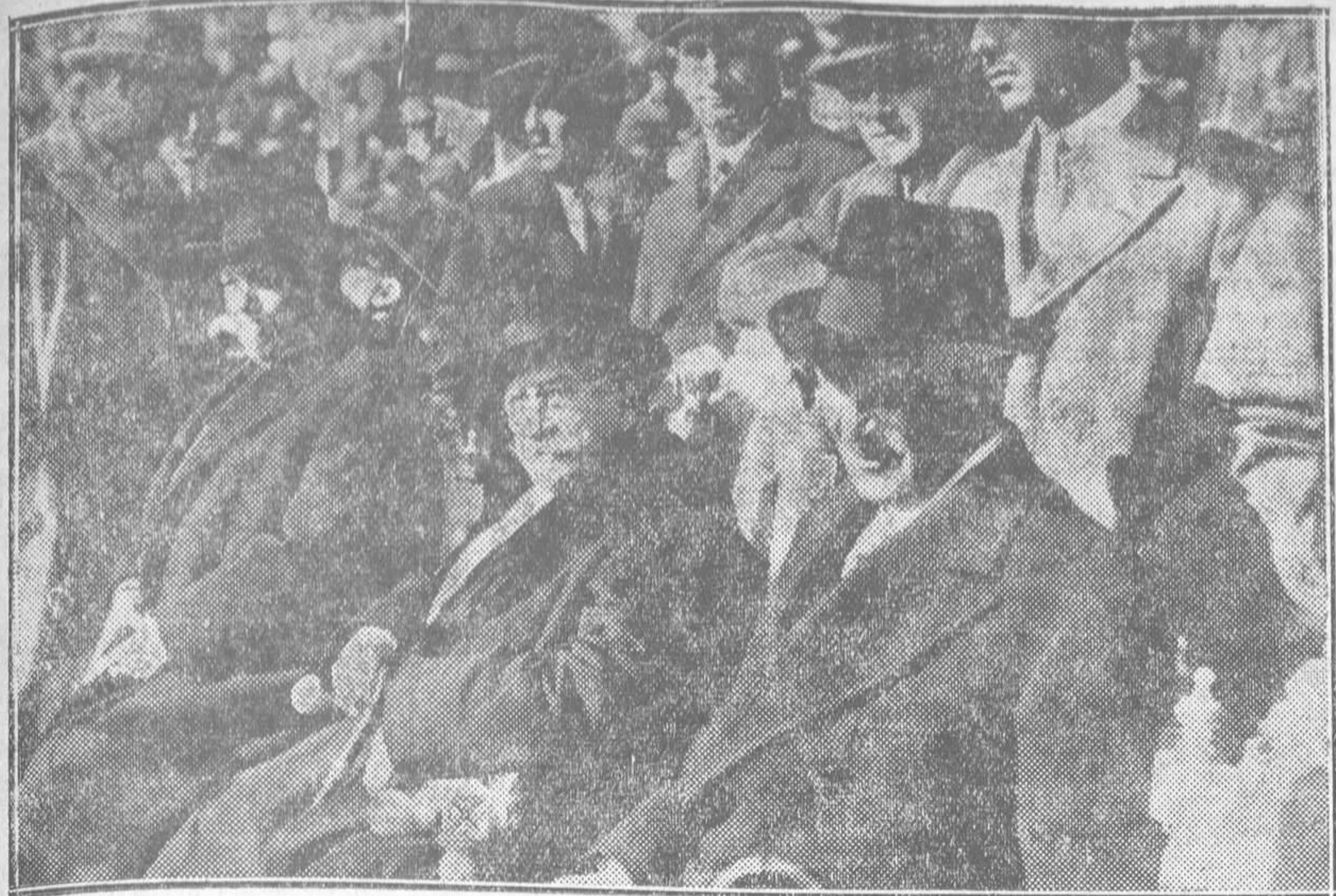
DON ALEJANDRO LERROUX Y LA PRESIDENCIA DEL ACTO

Los otros levantar el pensamiento hacia el Dios que han definido en el fondo de su alma. (Muy bien.) Yo digo que los hombres que hayamos perdido la fe religiosa, no podemos haber perdido la obligación de respetar aquello que en la conciencia de nuestros semejantes tiene un culto, ni podemos tampoco perder el respeto que merecen aquellas instituciones que en el pasado contribuyeron a la obra del progreso espiritual, aunque contemporáneamente, como todas las instituciones humanas, sobre todo en aquellos países que no han sabido, por el Estado, subordinarlas y someterlas a la ley, se hayan visto comprometidas por corrupciones que en otros países, que en otros Estados, como Suiza, como Alemania, donde se han estudiado esas tutelas, han sabido llegar a estados de pacificación que las hace a la vez que un instrumento de perfección moral, un instrumento de colaboración en la obra de los gobiernos. (Grandes aplausos.)