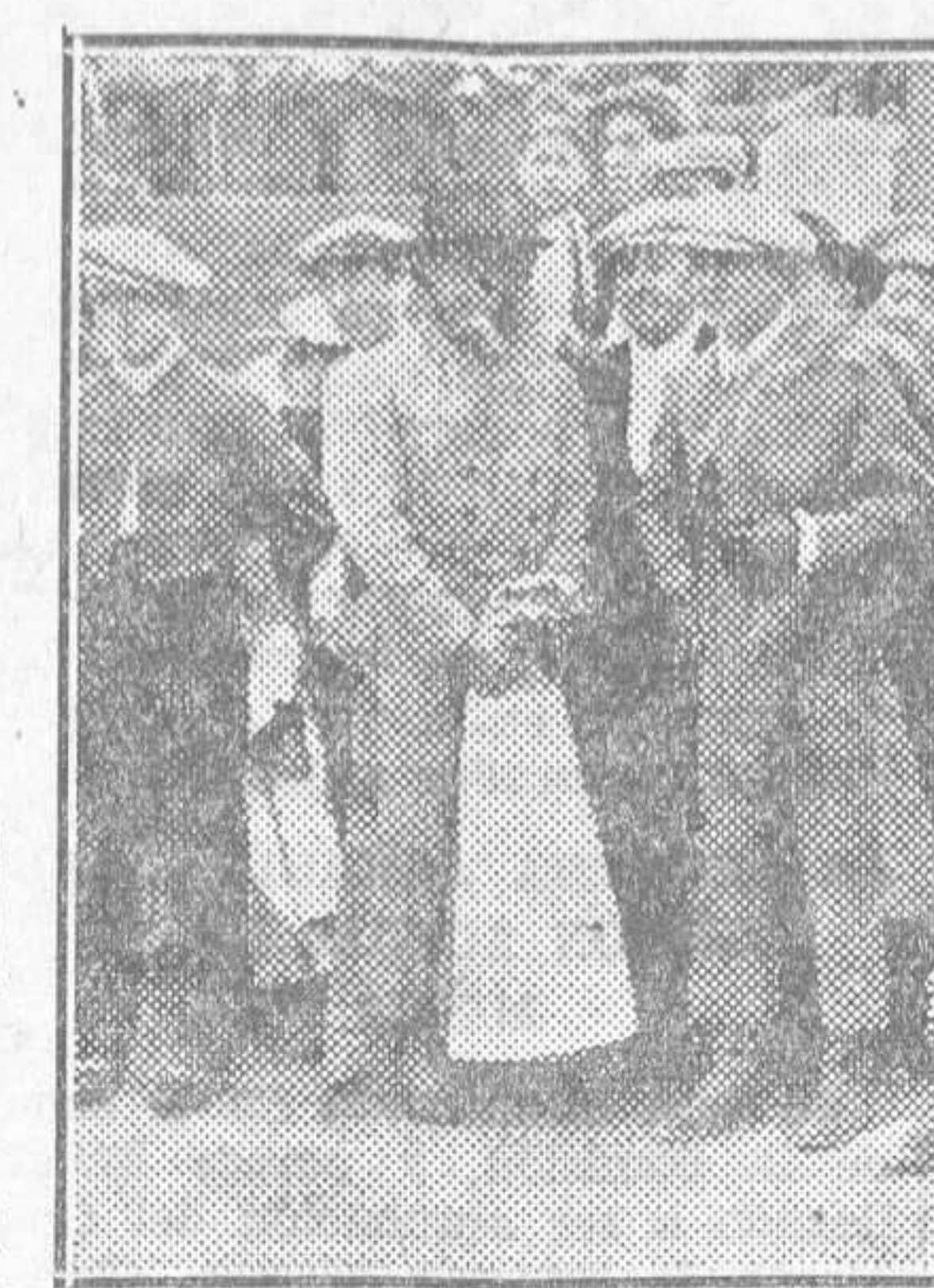
LOS PROTAGONISTAS DEL FESTIVAL TAURINO FALLERO

Fué una desventura la entrada y, por tanto, las utilidades, si las ha habido. El escaso público, en