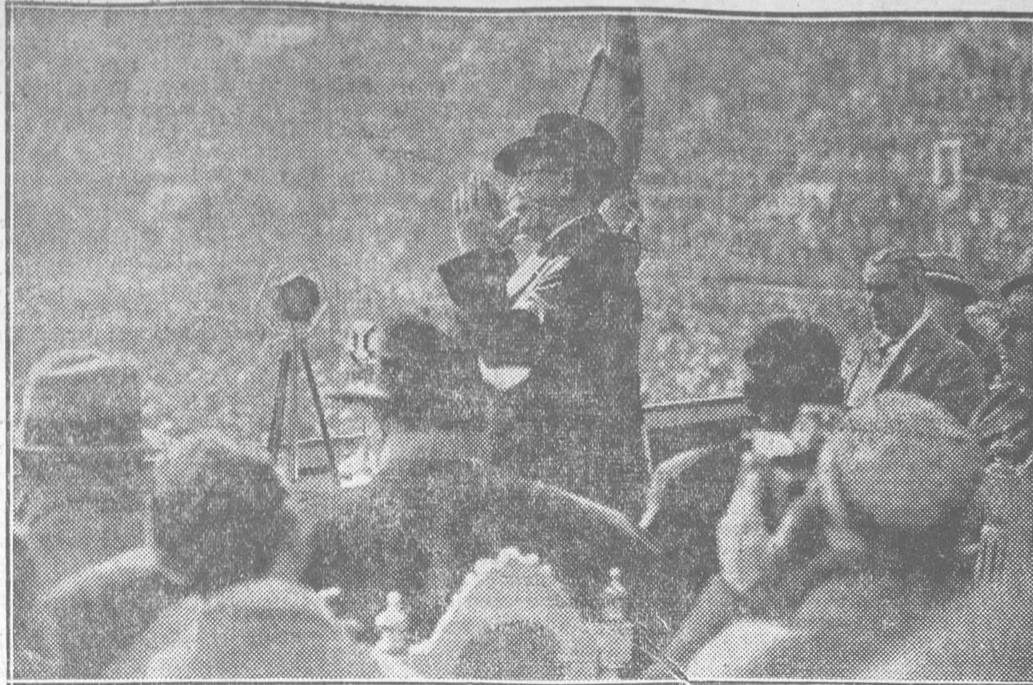
EL MOMENTO DEL DISCURSO

Porque toda esa situación que se ha creado en casi todo el agro español, que se ha manifestado con mayor agudeza en aquellas provincias donde el estado de la propiedad está reclamando más urgentemente la reforma; todo ese estado moral que se ha producido es parte principal para ese decaimiento del valor de la peseta, para ese encarecimiento del precio de la vida, para esa iniqui-