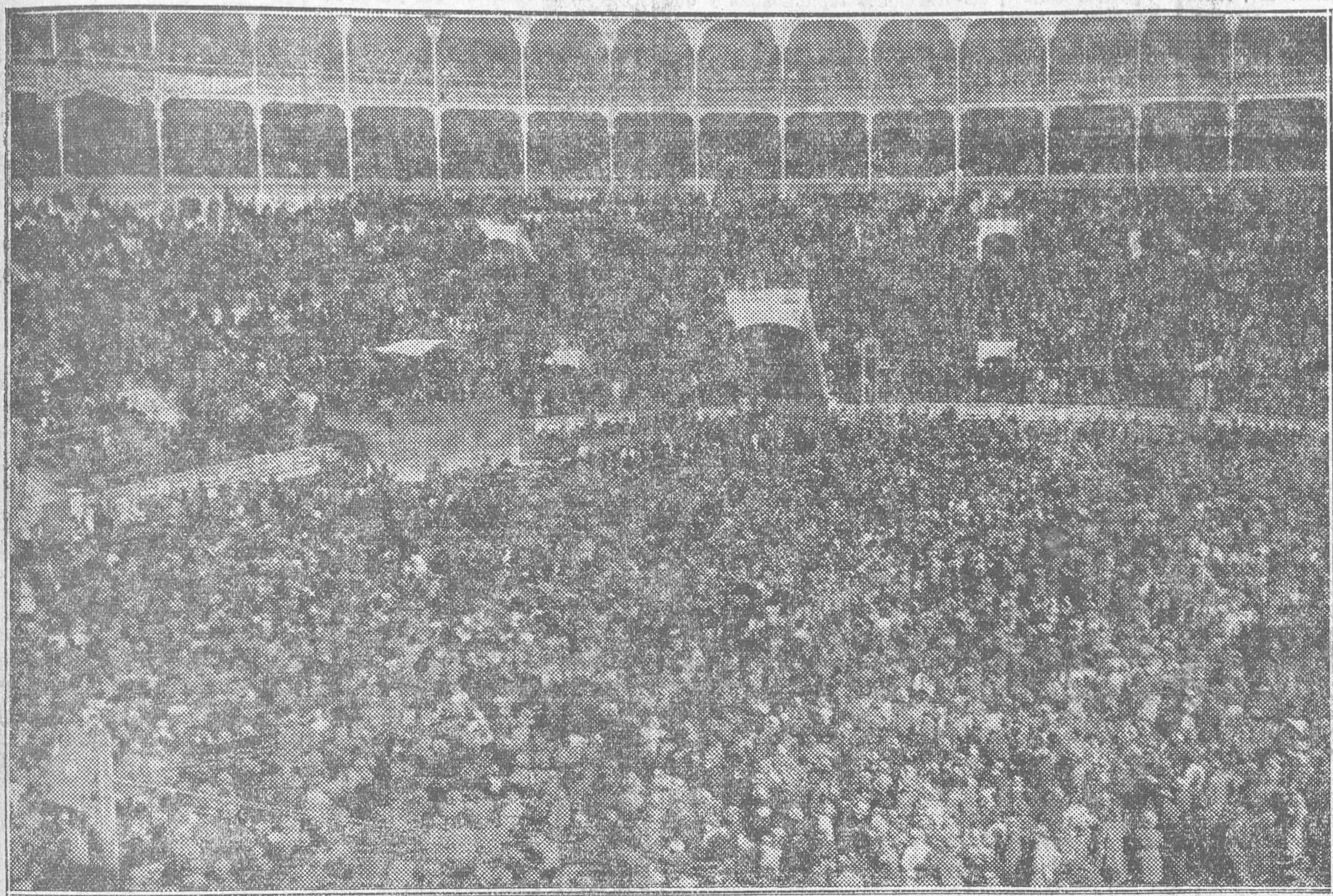
SORBERBIO ASPECTO DE LA PLAZA DE TOROS MONUMENTAL, DURANTE EL GRANDIOSO ACTO DEL DOMINGO

El republicanismo hispano ha hecho una marcha sobre Madrid.--El discurso de Lerroux, ha sido pieza oratoria de un gobernante: ante la reacción, revolucionario; ante la anarquía, conservador.--Su silencio ha terminado en la calle y va a terminar en el Parlamento.--Por la República, todo.--El republicanismo histórico ha tenido su leader.--Los problemas españoles juzgados por Lerroux.--Los presupuestos de Carner, han quedado triturados.--Cuándo y cómo se debe gobernar en republicano