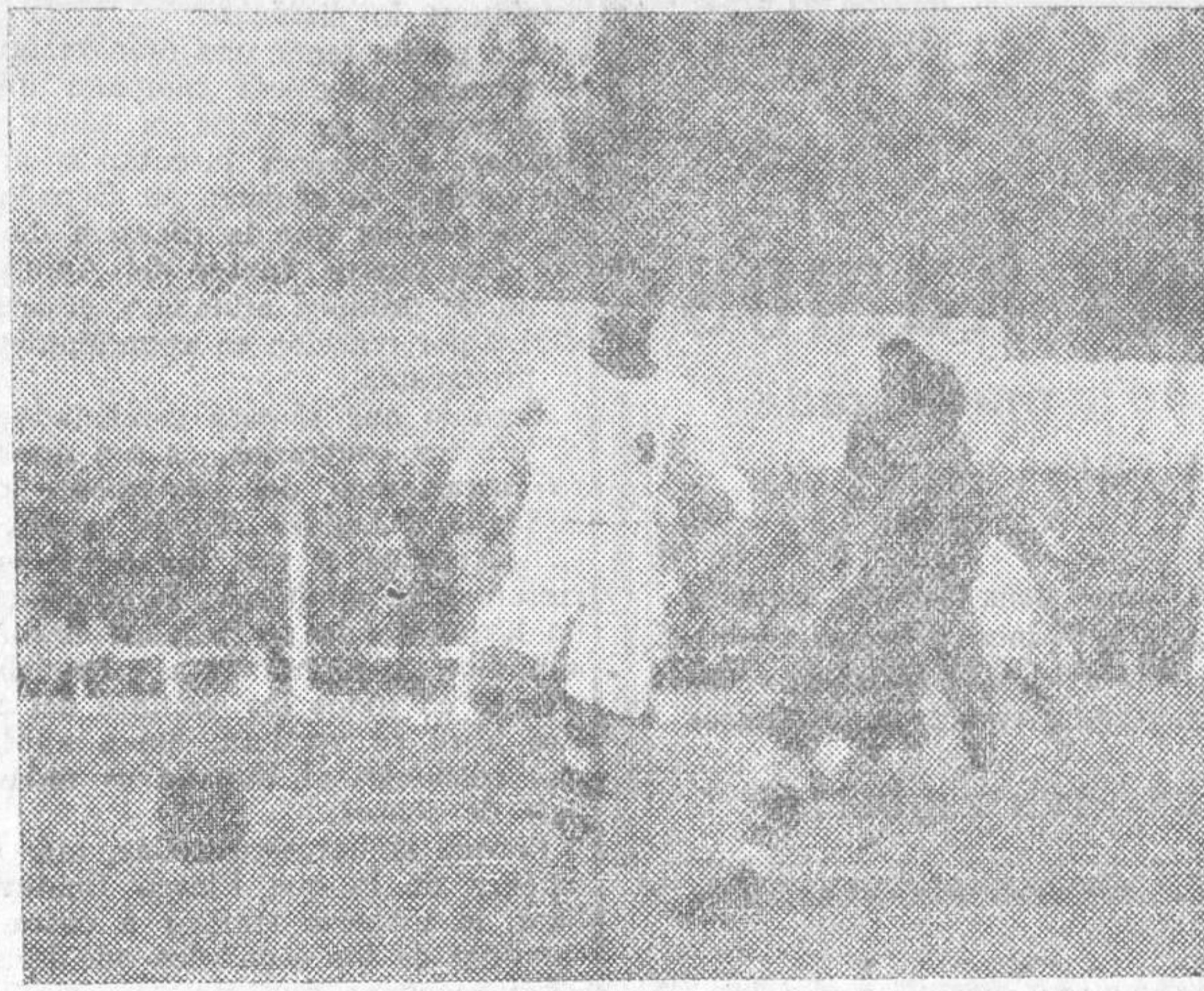
Un momento interesante de la jugada que precedió al primer goal del Valencia