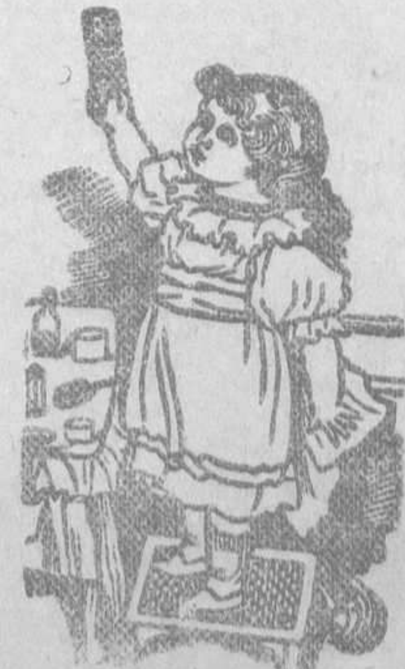
CAJA-ESTUCHE, 425 PESETAS