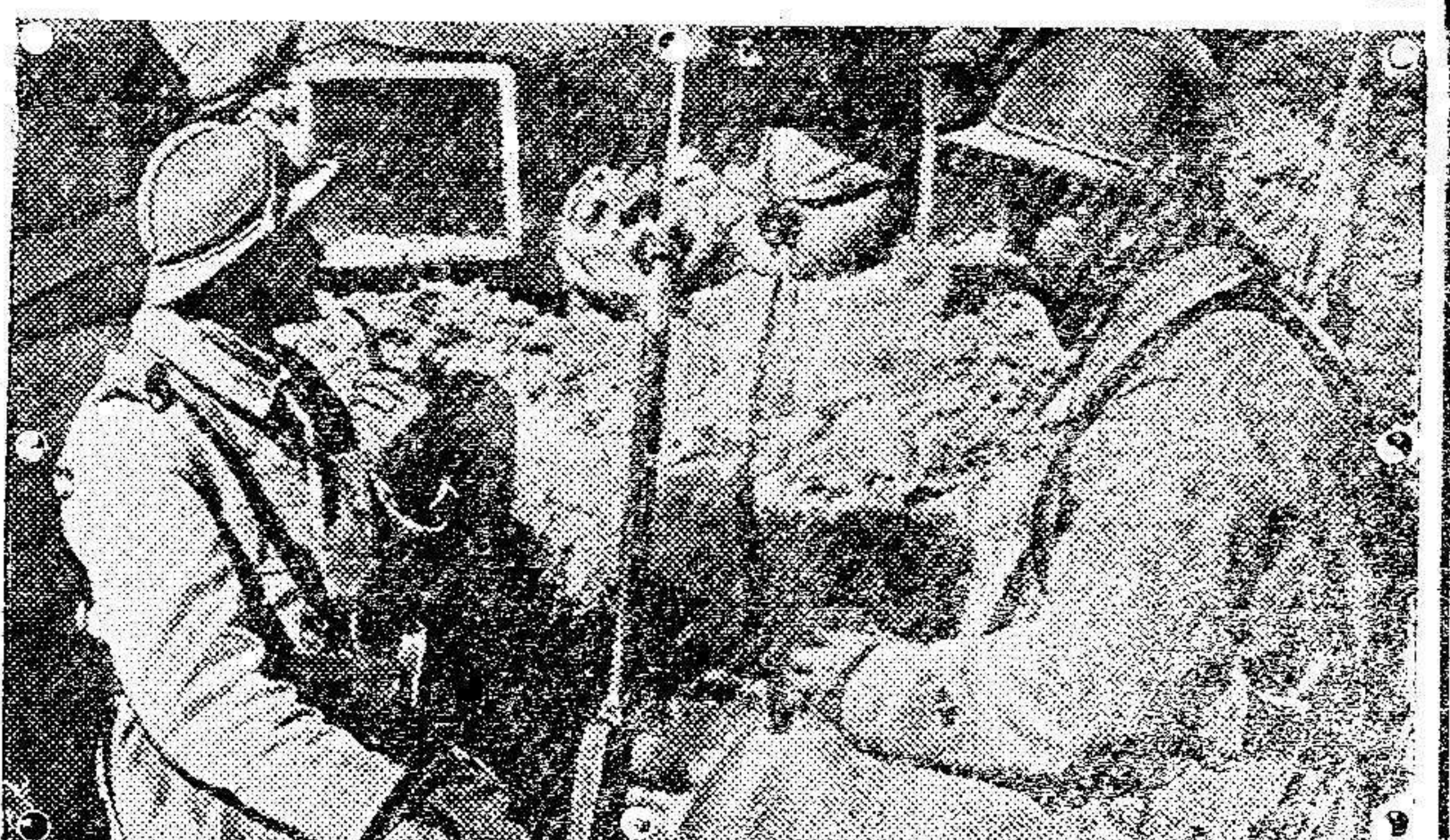
El puesto de observación de guardia en una trinchera francesa.

Con el anuncio económico, en periódico de la circulación de EL TELEGRAMA DEL RIF, se gana tiempo y dinero.