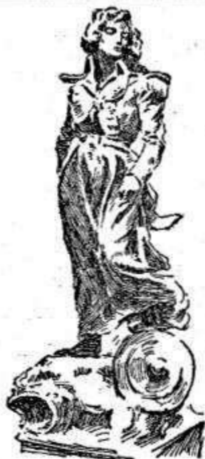
Estátua de Agustina Zaragoza, que corona el monumento erigido á las heroínas zaragozanas.