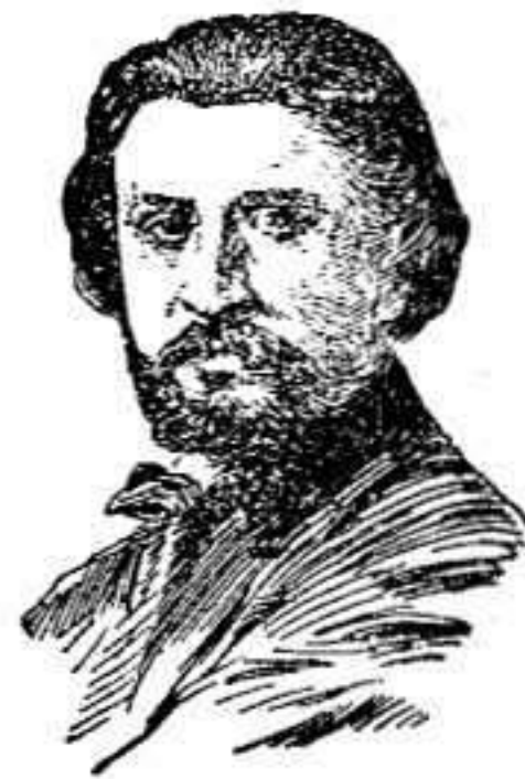
El Maestro Manén

El célebre violinista español Juan Manén, tan poco conocido en España y tan admirado y festejado en el extranjero, muy en breve estrenará su ópera «Acte» en el teatro de la Opera Real de Dresde, y cuyos ensayos dirige el propio autor.