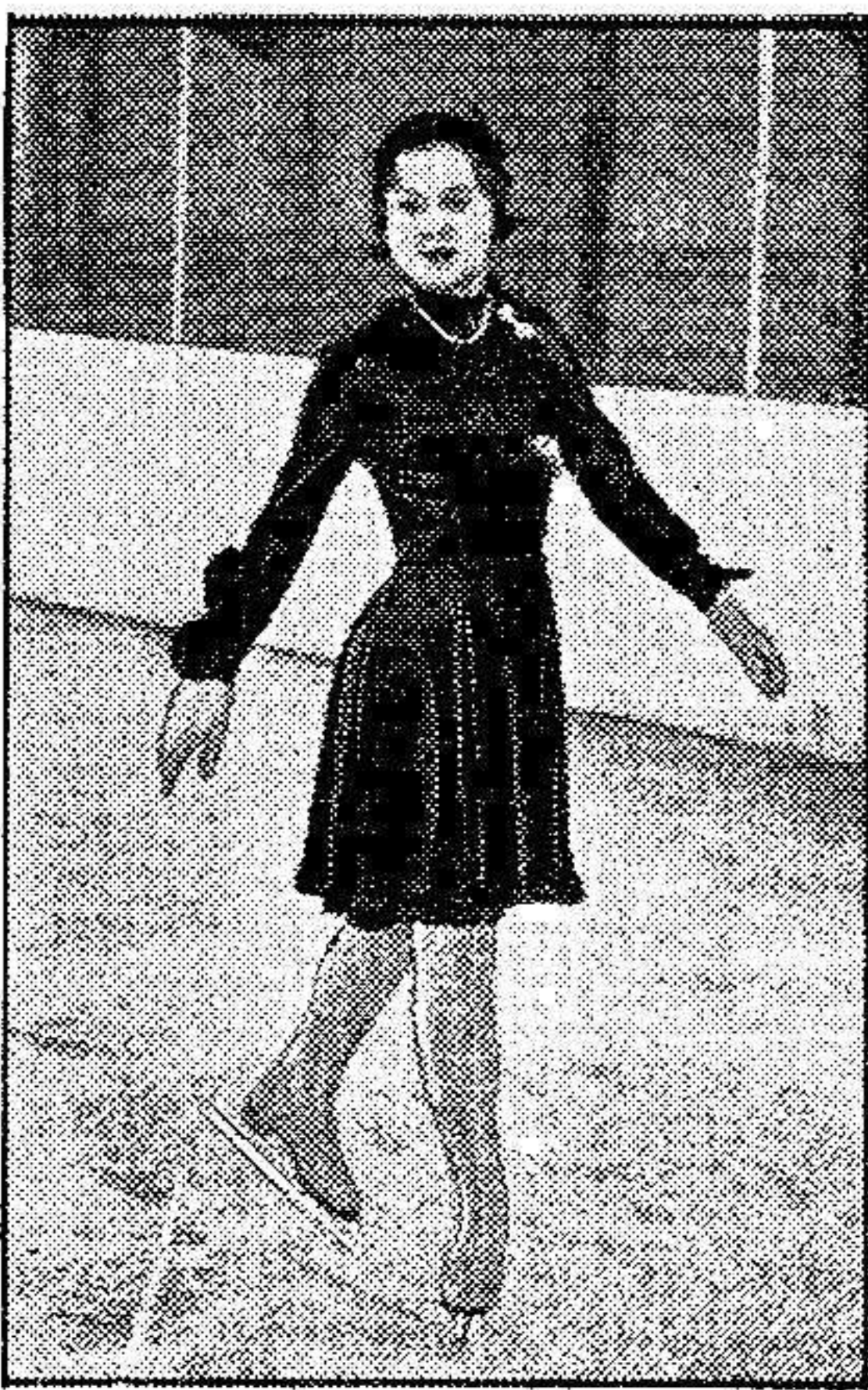
La patinadora noruega, señorita Sonja Henie, fotografiada en América, en el momento de obtener el campeonato del mundo.