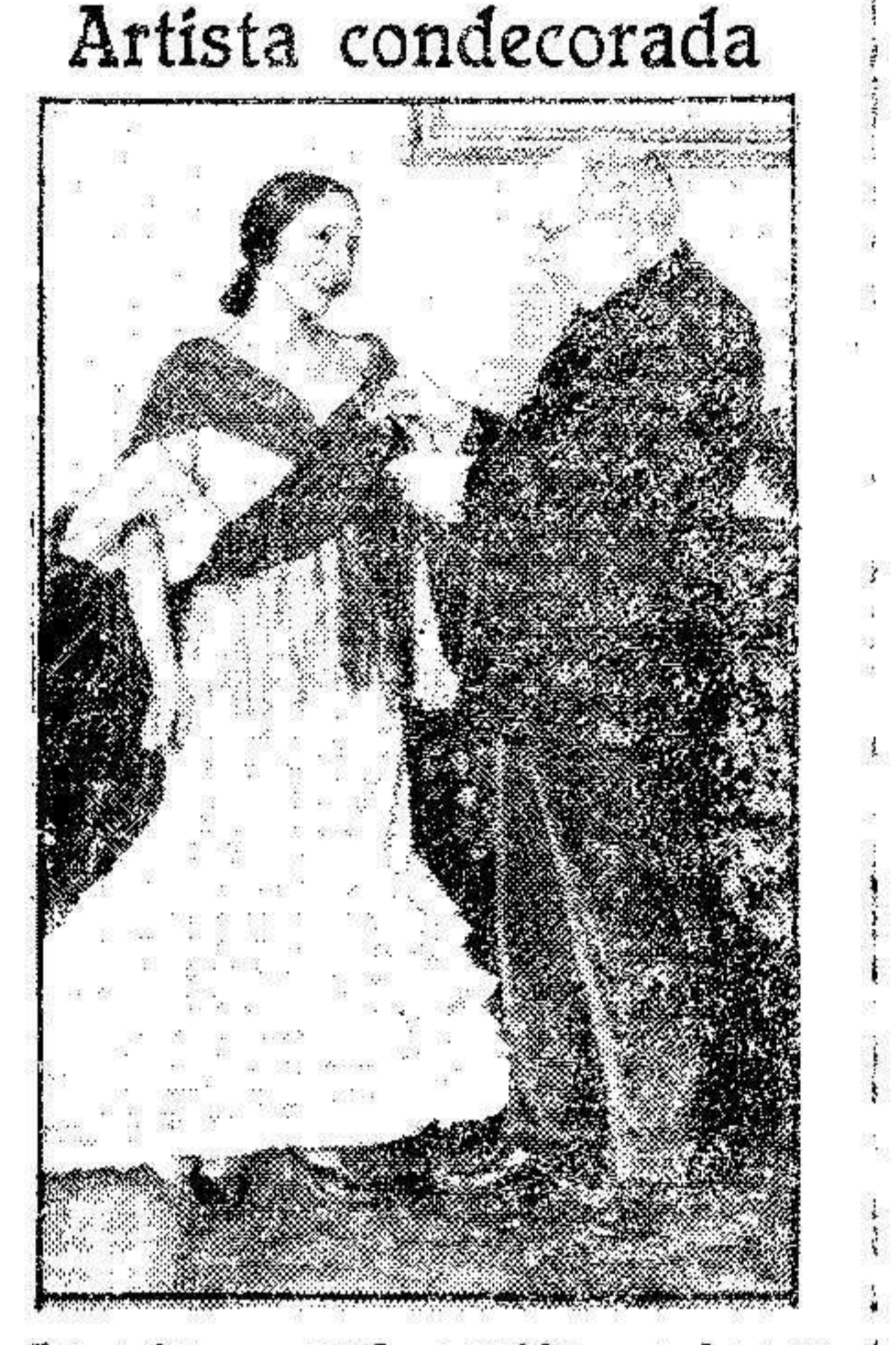
La primera condecoración que ha concedido la República española ha sido a la famosa artista «La Argentina»...