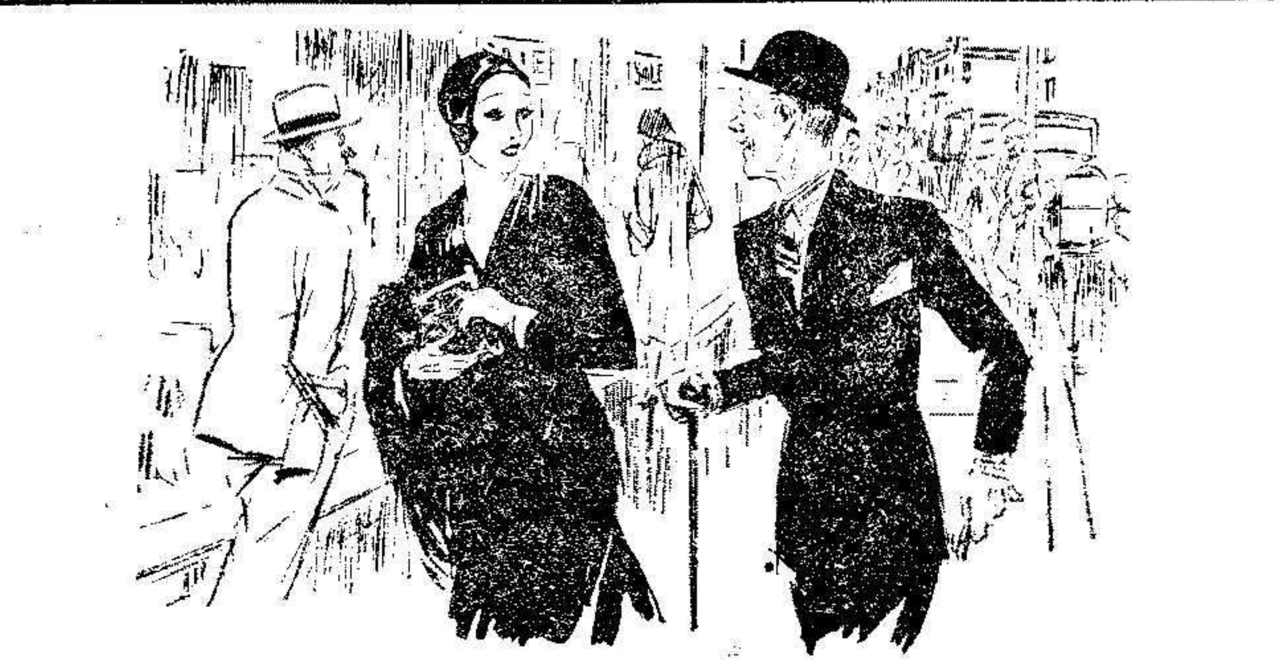
LOS MALOS INVITADOS

Con extraordinaria animación y brillantez, se celebraron ayer los festejos finales organizados por los vecinos del simpático barrio del Carmen, en honor de su titular. A las ocho de la mañana, una banda de música, precedida de gigantes y cabezudos, recorrió las principales calles del barrio, tocando alegres danzas. Los cabezudos, con sus piruetas, causaron las delicias de la gente menuda. A las seis se celebró el popular festejo de elevación de globos, y seguidamente los Exploradores melillenses hicieron una admirable exhibición escu-