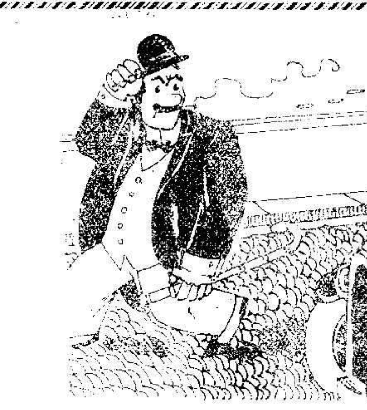
EL OLVIDO DE LA PROPINA

SE LEVANTA EL ESTADO DE GUERRA Málaga 9 A las siete de la tarde, terminó la junta de autoridades.