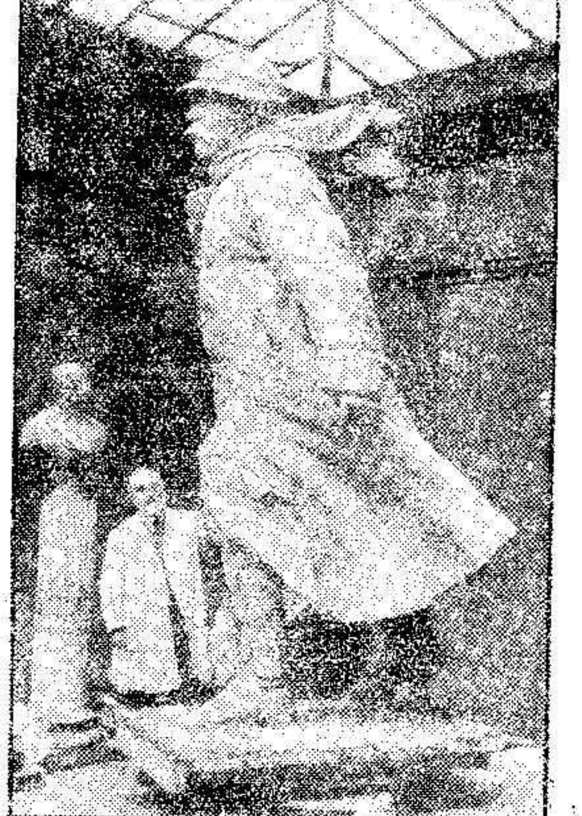
He aquí la estatua de Clemenceau, que el escultor M. Francisco Cogan ha concebido para emplazarla en los Campos Eliseos de París.