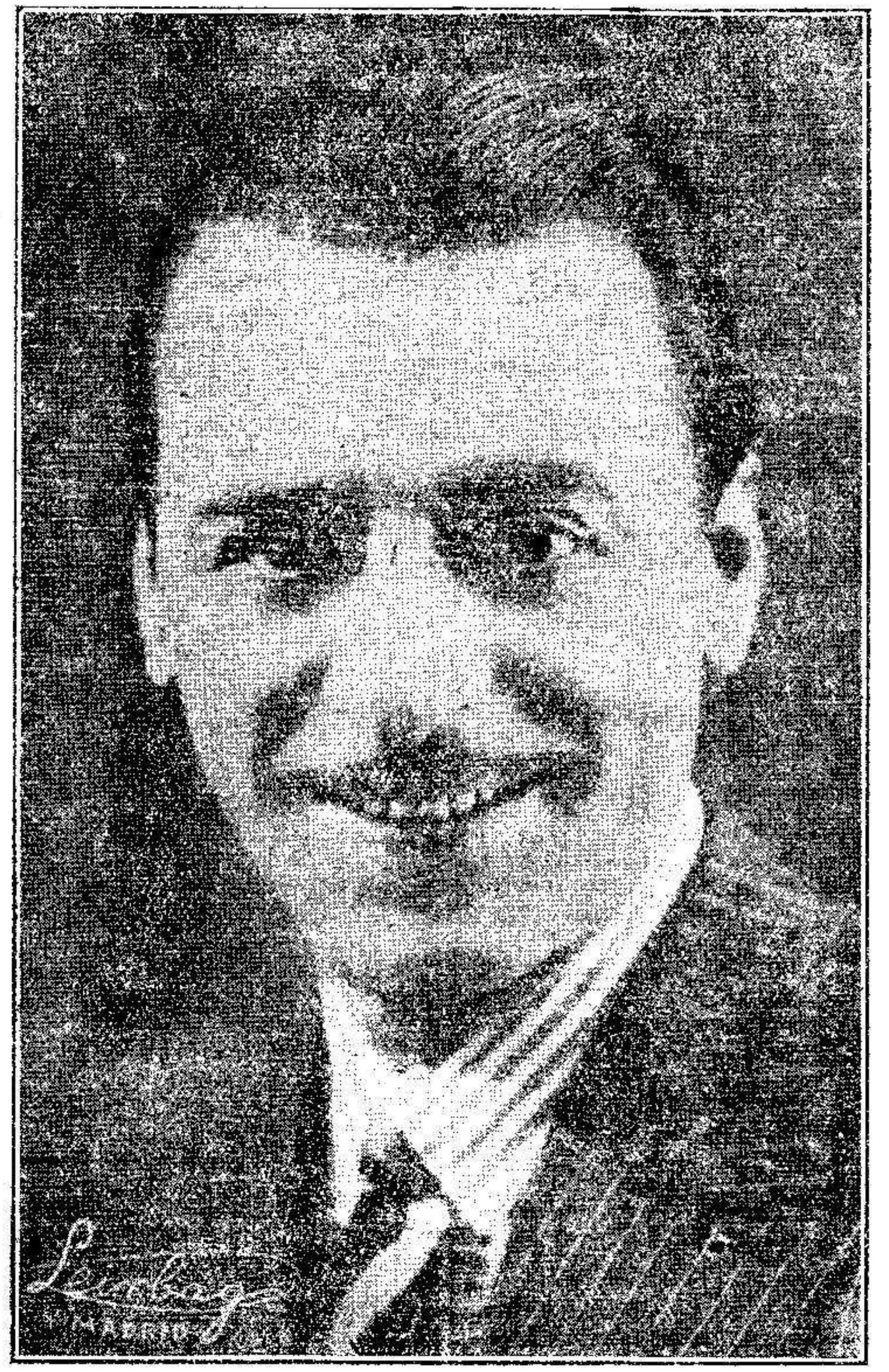
El celebrado artista de la pantalla, español Valentin Parera