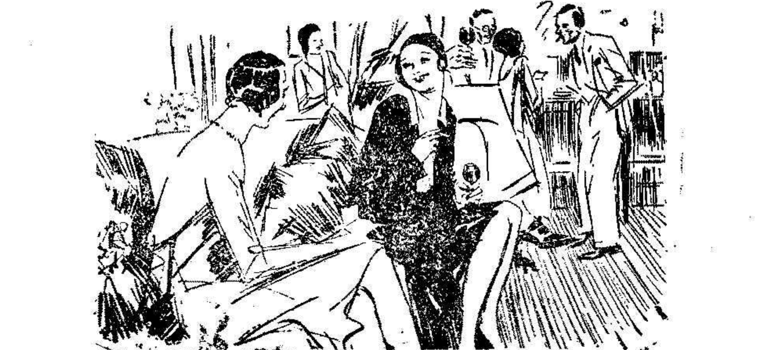
LA INDUCCION CANINA

SANATORIO DE SAN JOSÉ MÁLAGA. Novísimo e ideal para el tratamiento de la neurastenia, nerviosos y mentales. Espléndido parque, Recreos. Hermanos de San Juan de Dios