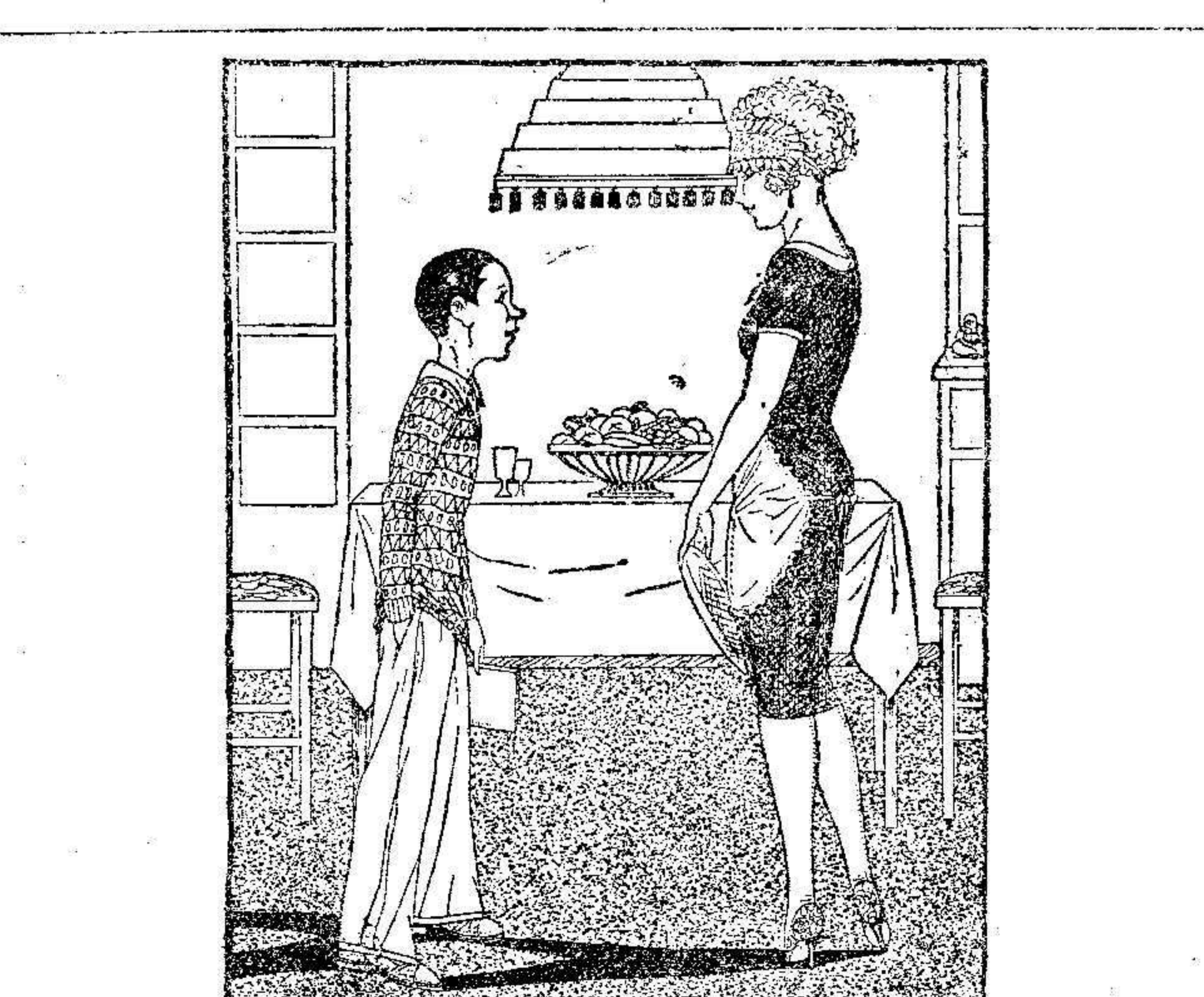
EL DISCIPULO AVANTAJADO

El autor del hecho fué detenido quedando a disposición de las autoridades.