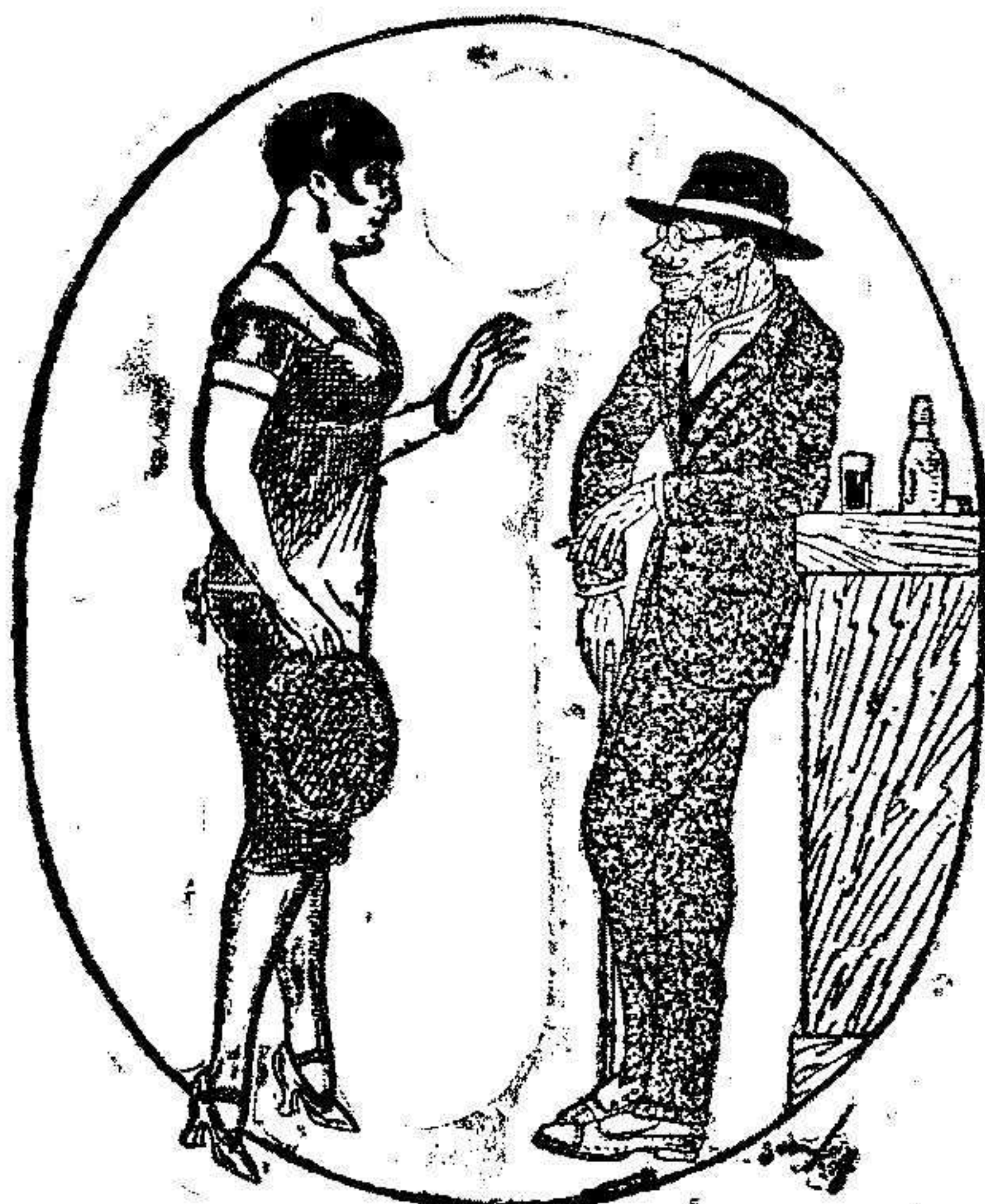
LA LICENCIA DE ARMAS. —Voy a pedir licencia para usar armas. —Pero, ¿es que lleva usted grandes cantidades? —¡Cómo voy a llevarlas, si no tengo aún en mi poder la pistola!