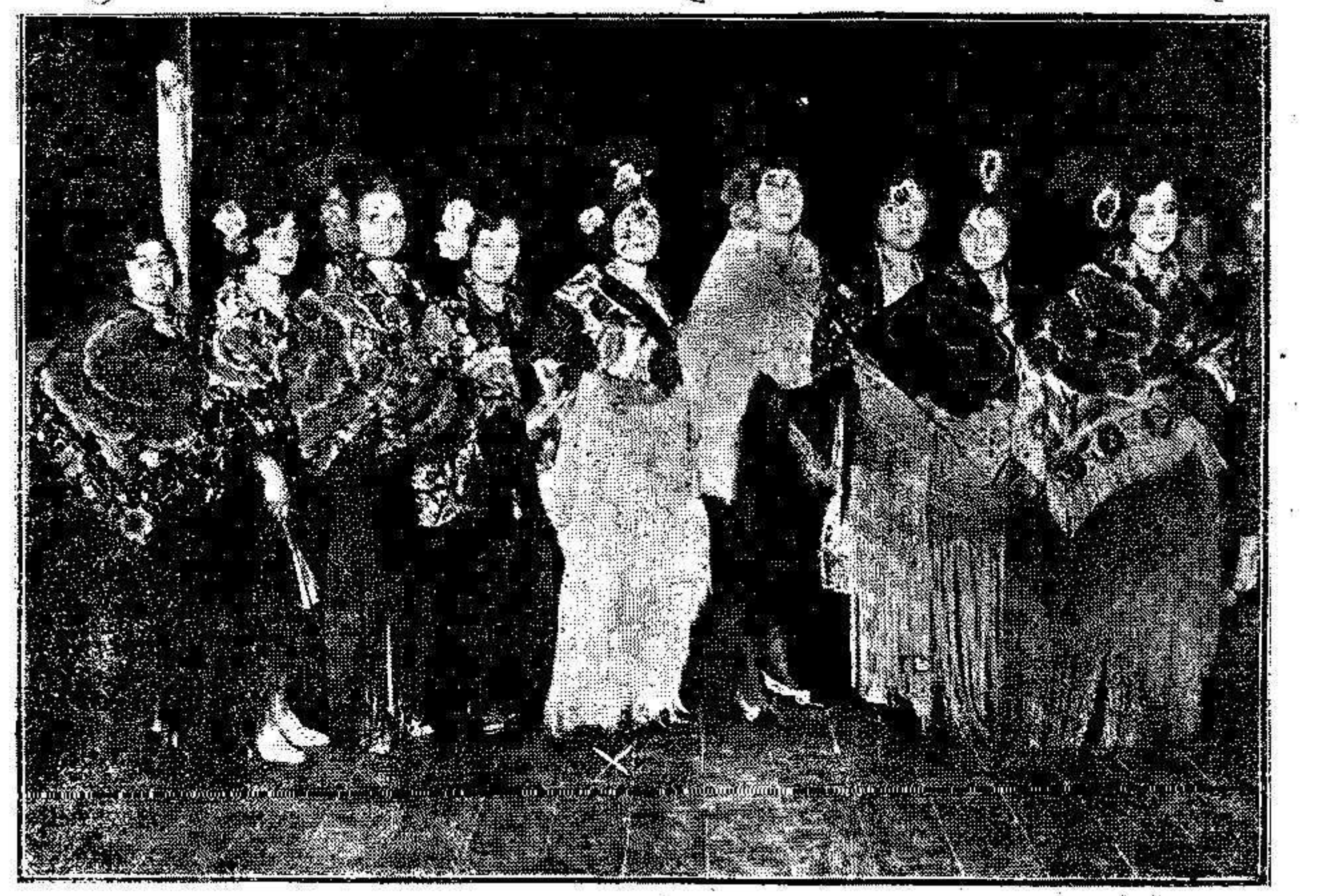
Grupo de bellas señoritas que tomaron parte en el concurso de mantones de Manila celebrado en el barrio del General Arizón, durante los festejos en honor de la Virgen de la Montaña.

La retreta militar. Ayer se reunió la comisión encargada de la organización de la retreta que se celebrará durante los próximos festejos.