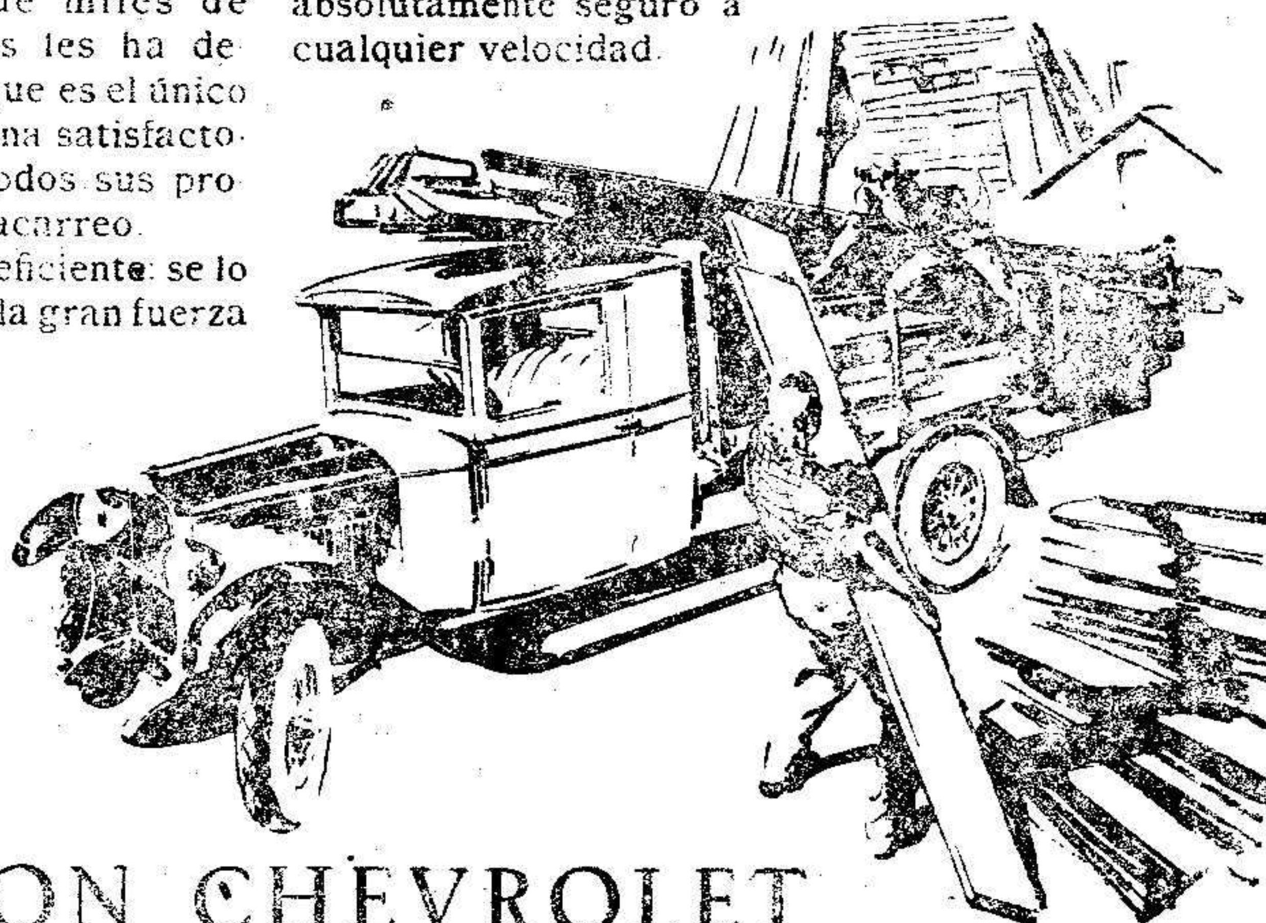
Su enorme capacidad y resistencia, y su gran economía, le hacen insustituible

CAMION CHEVROLET Fabricado por General Motors