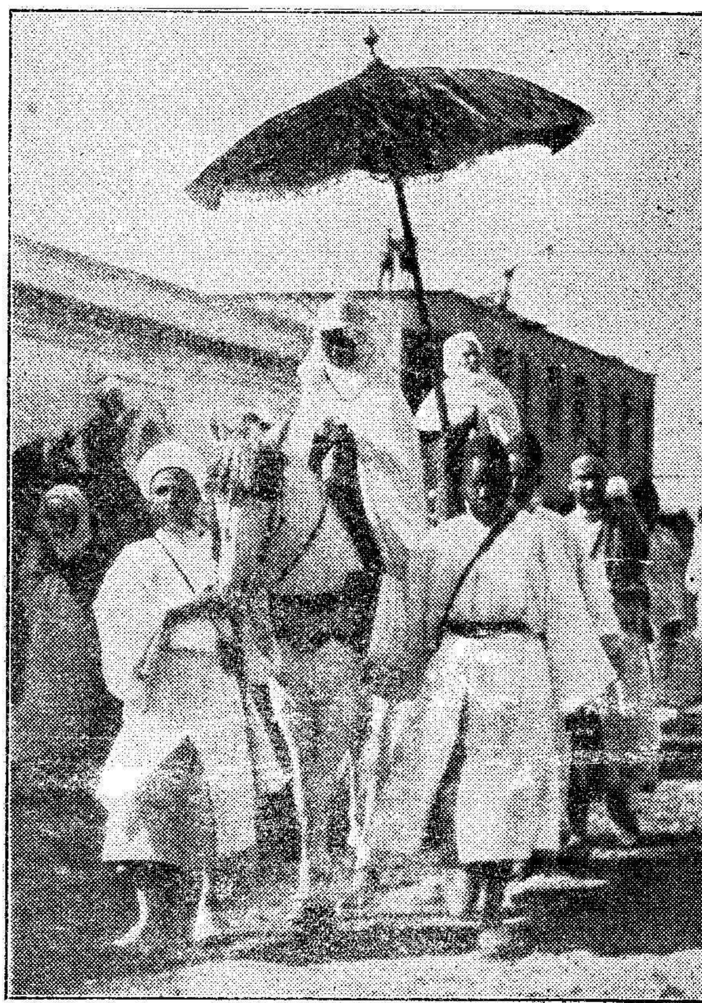
TETUÁN.—S. A. I. el Jefe de las fuerzas que le rindió honores en el acto de la proclamación.