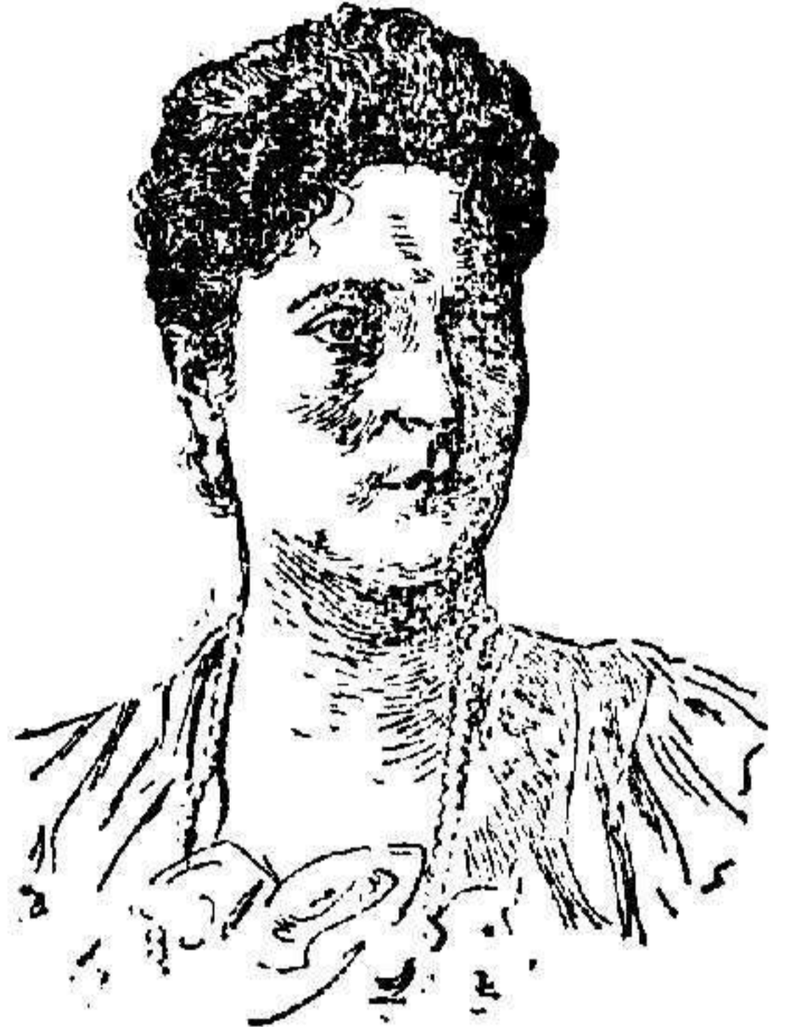
La emperatriz de Rusia

Mal empieza para las familias de los soberanos europeos la época de los frios. Primero el gran duque de Baden, después el de Parma y últimamente el rey Oscar de Suecia, han rendido á la muerte el ineludible tributo, con una diferencia de muy pocos días.