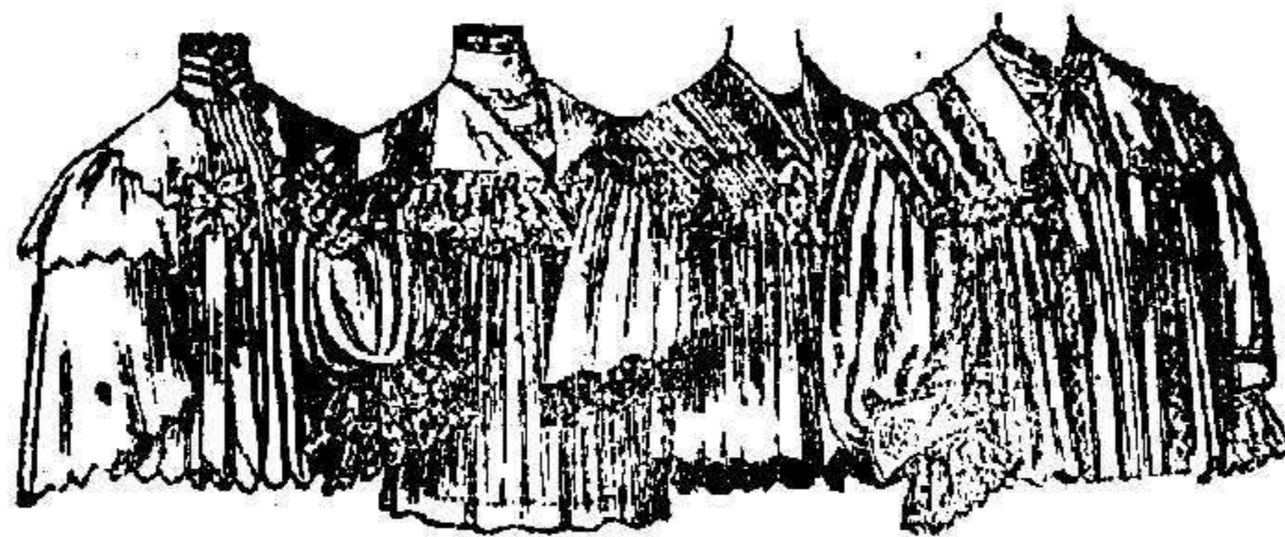
EL ÚLTIMO FIGURÍN