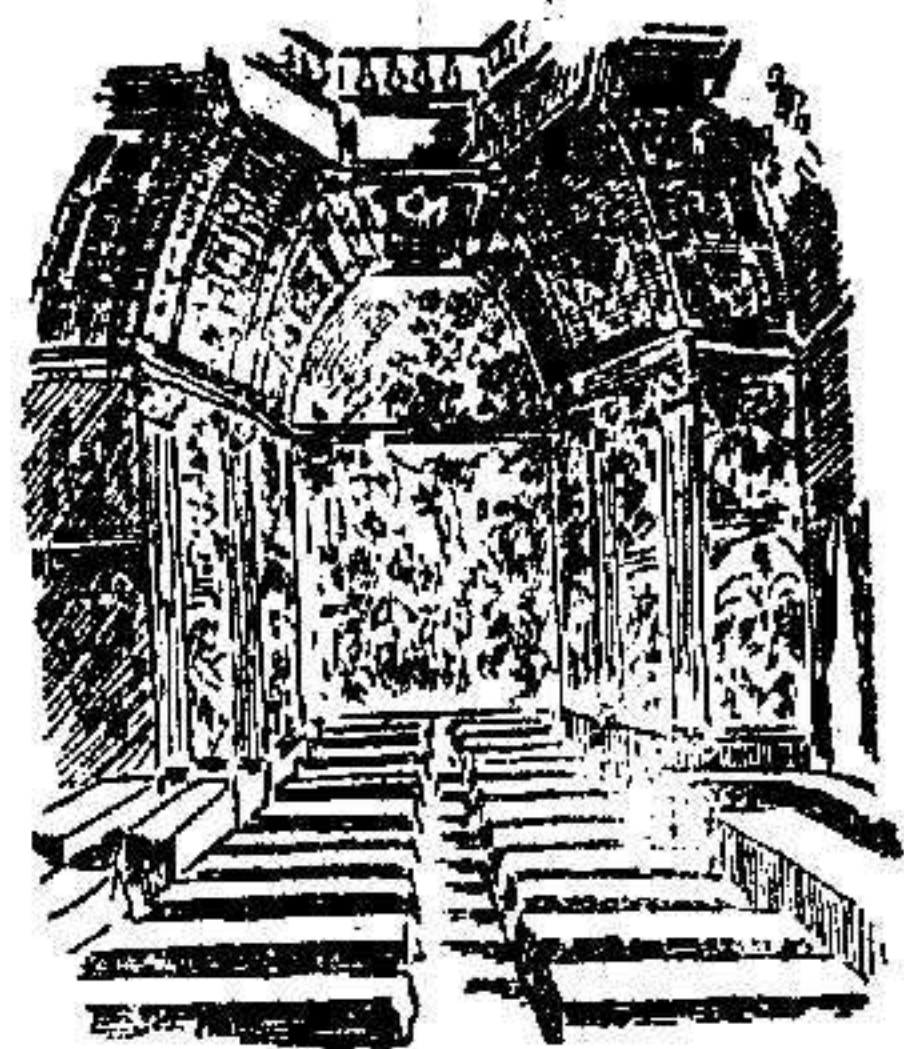
Sala de los Caballeros, del Palacio del Bosque, donde la Conferencia de la Paz celebra sus sesiones.