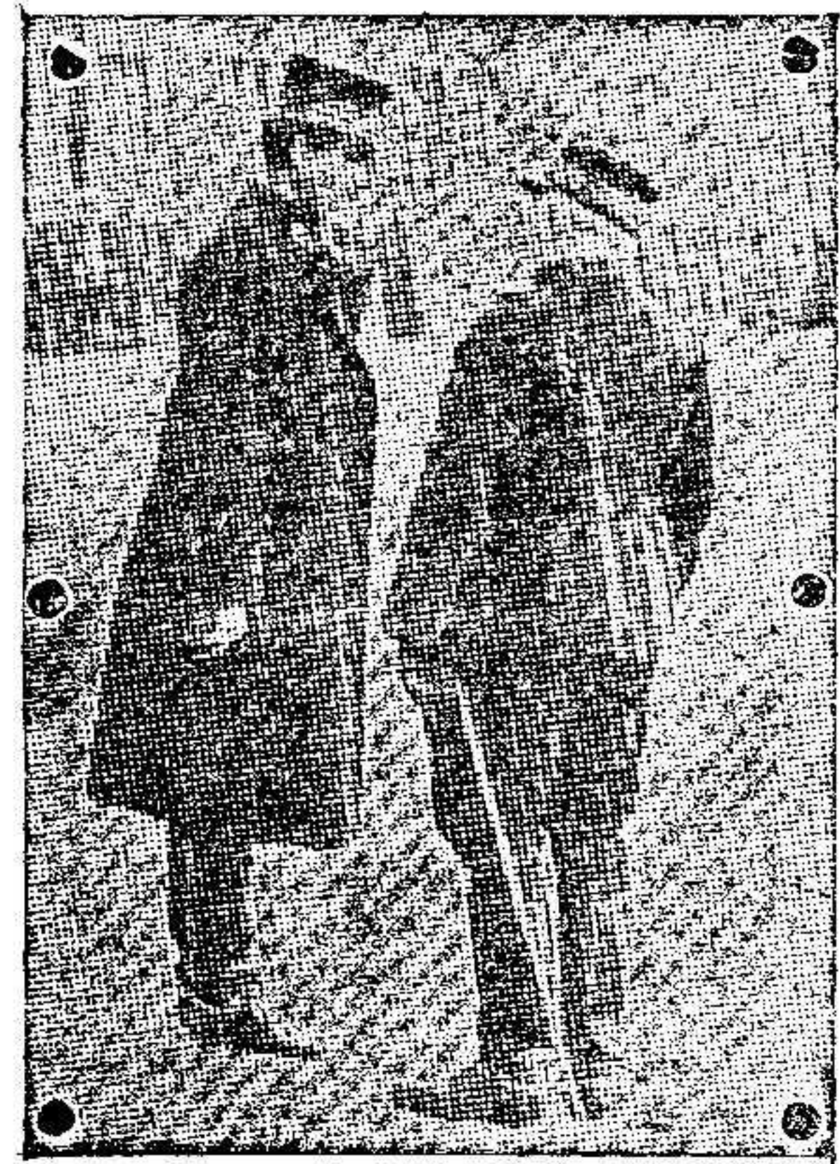
El Rey de los belgas conversando con el General francés Mr. Castelneau.

Clases prácticas de contabilidad. Preparaciones de carreras civiles. O'Donnell S. Para detalles al Sr. Interventor del Banco de España.