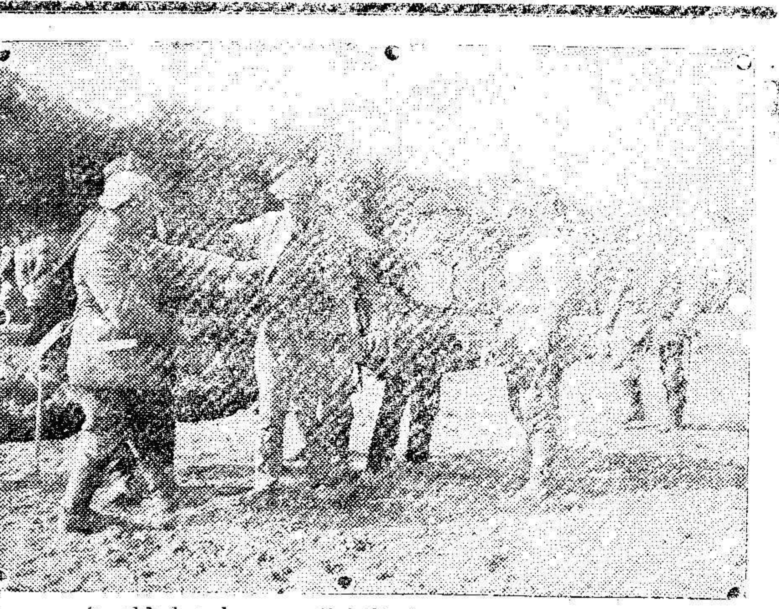
Un grupo de soldados alemanes divirtiéndose con un muñeco que representa un cosaco.