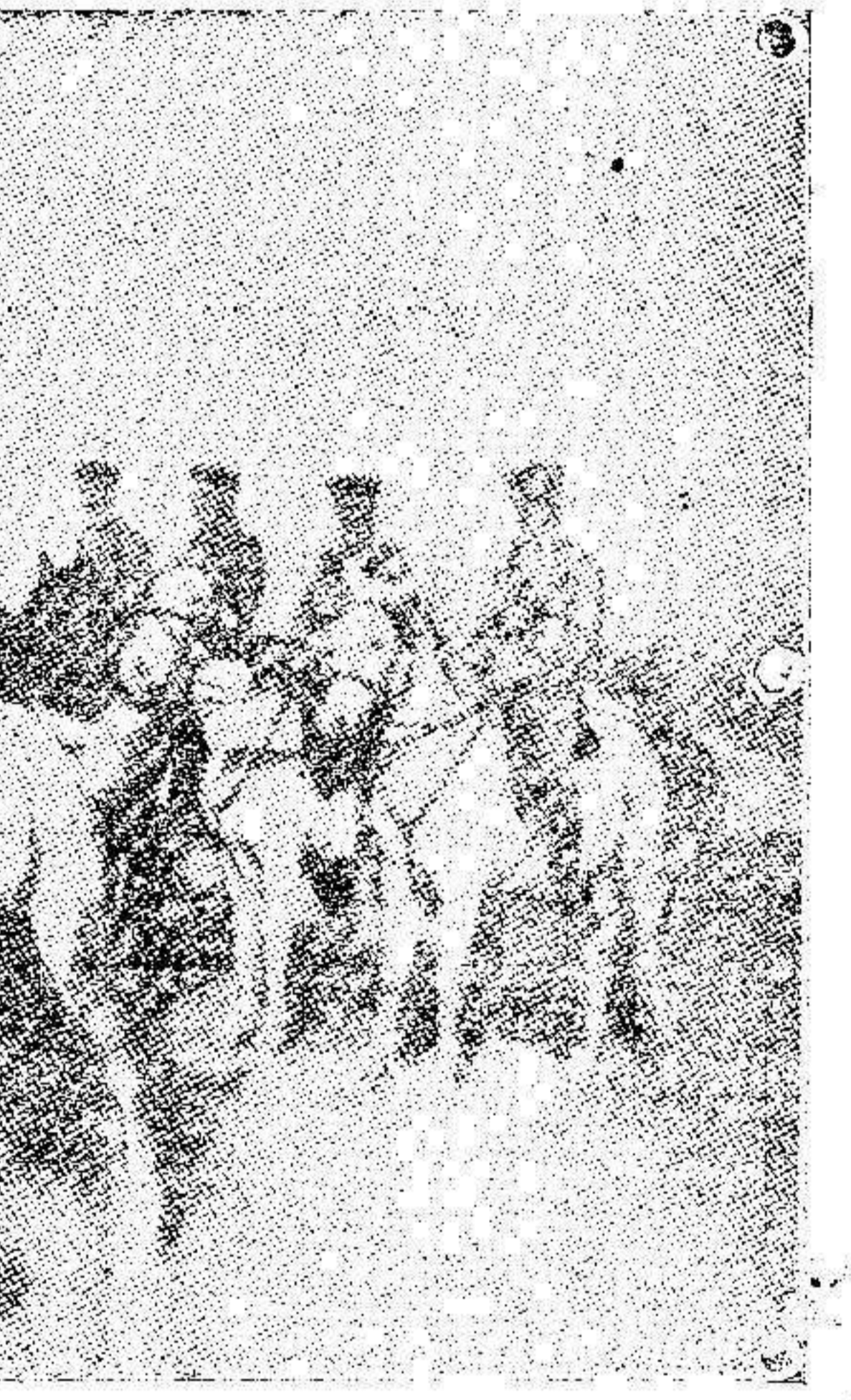
Soldados de caballería de un regimiento alemán en una de sus colonias africanas.

De lo remitido a Canarias, fueron 218.459 kilogramos a Santa Cruz de Tenerife; 103.983 a Las Palmas, y 5.925 a Arucas.