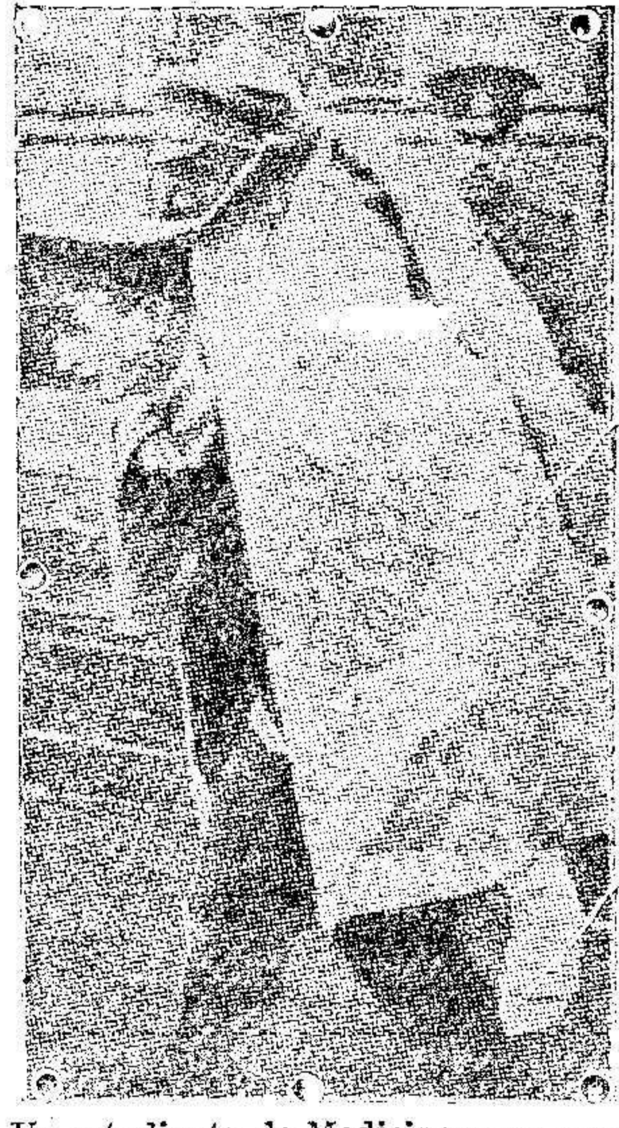
Un estudiante de Medicina ruso con un soldado herido a costas con dirección a un hospital de Moscu.