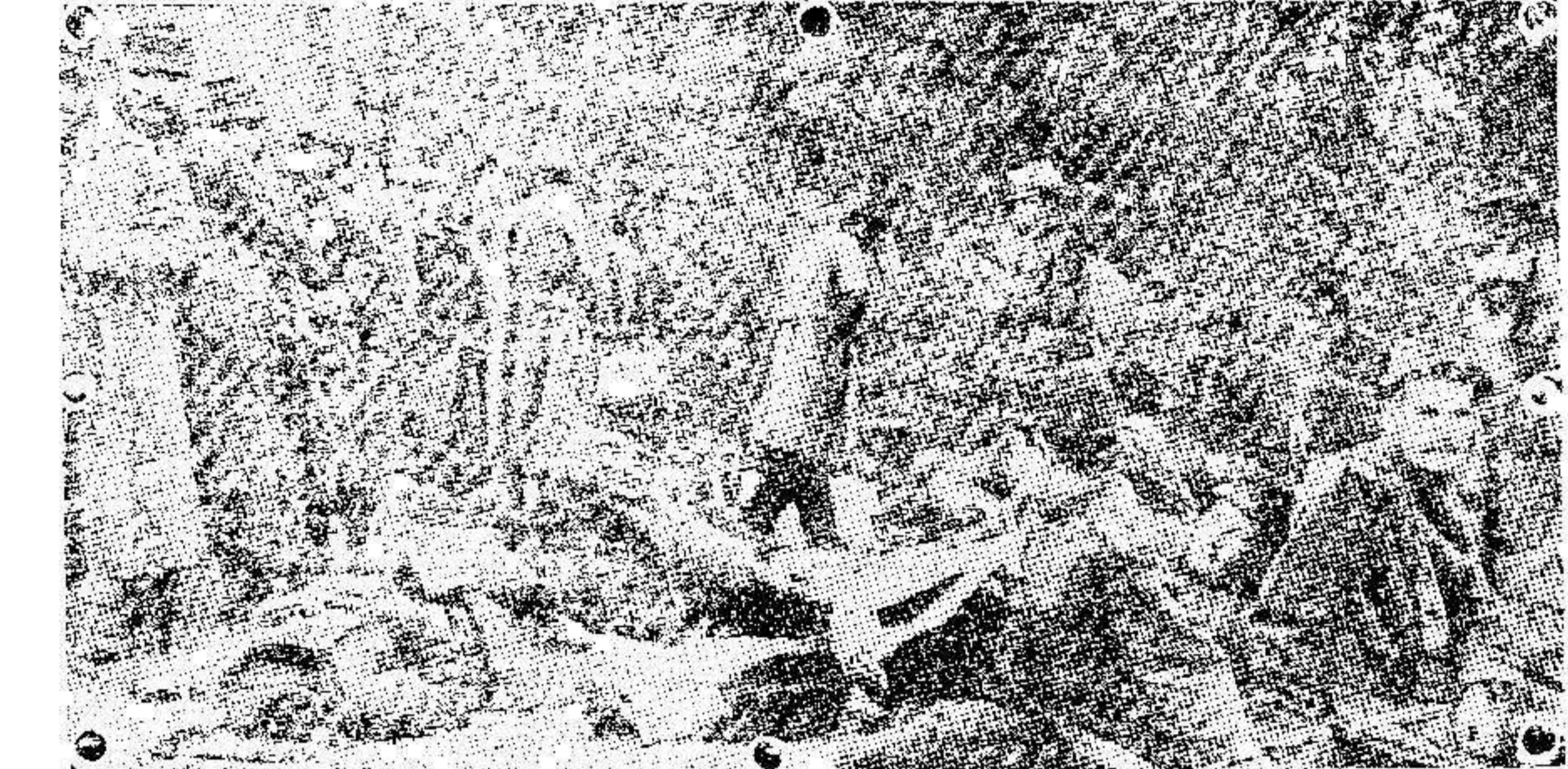
Soldados franceses prisioneros, muchos de ellos heridos, esperando que se les envíe a un campo de concentración de Alemania.

Nuestro primer paseo se vió muy concurrido, aprovechando la hermosa y primaveral temperatura que disfrutamos.