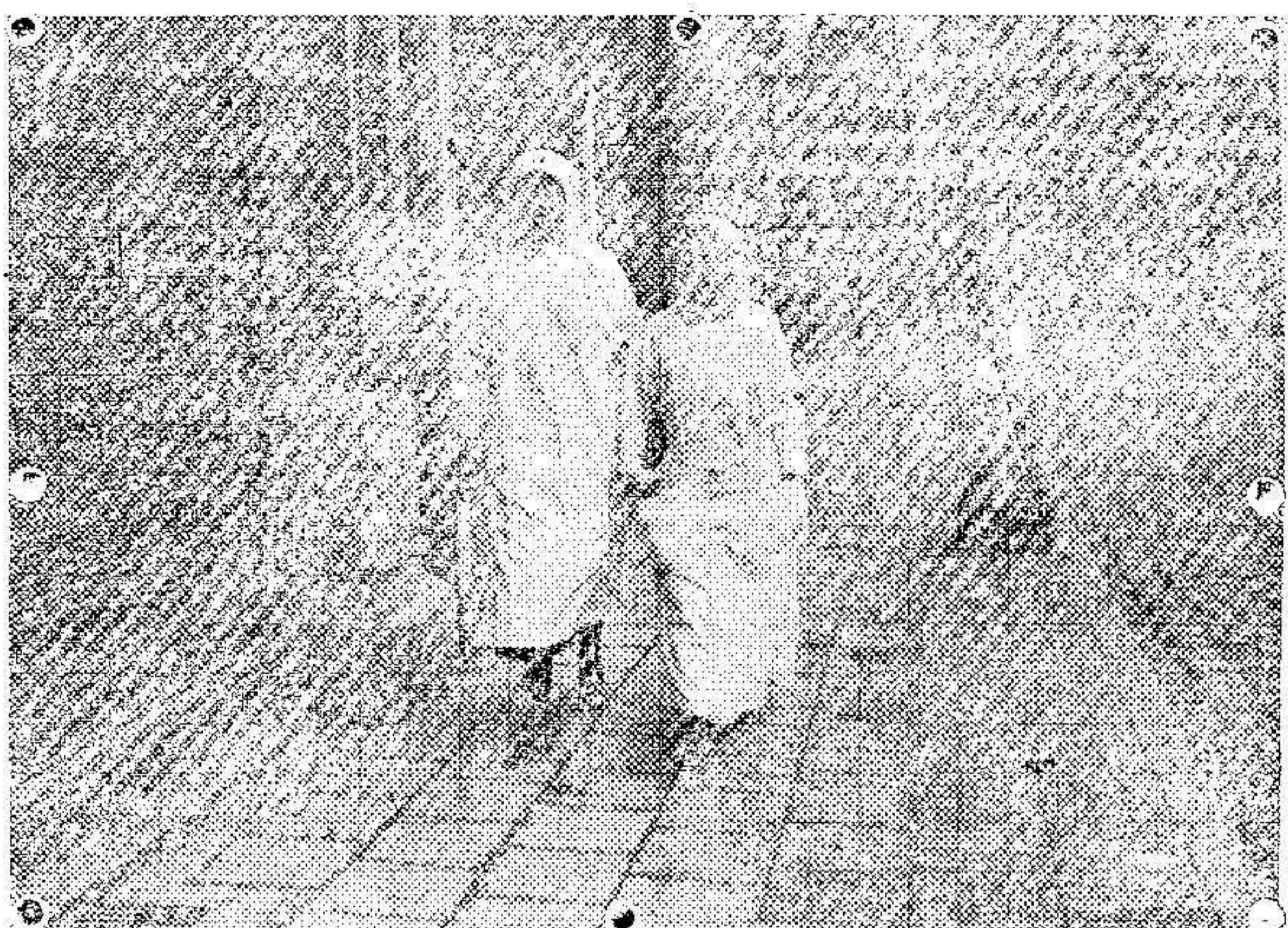
Señoritas belgas de la Cruz Roja por las calles de Amberes.

Franqueo concertado.—No se devuelven los originales. NÚM. 9.134