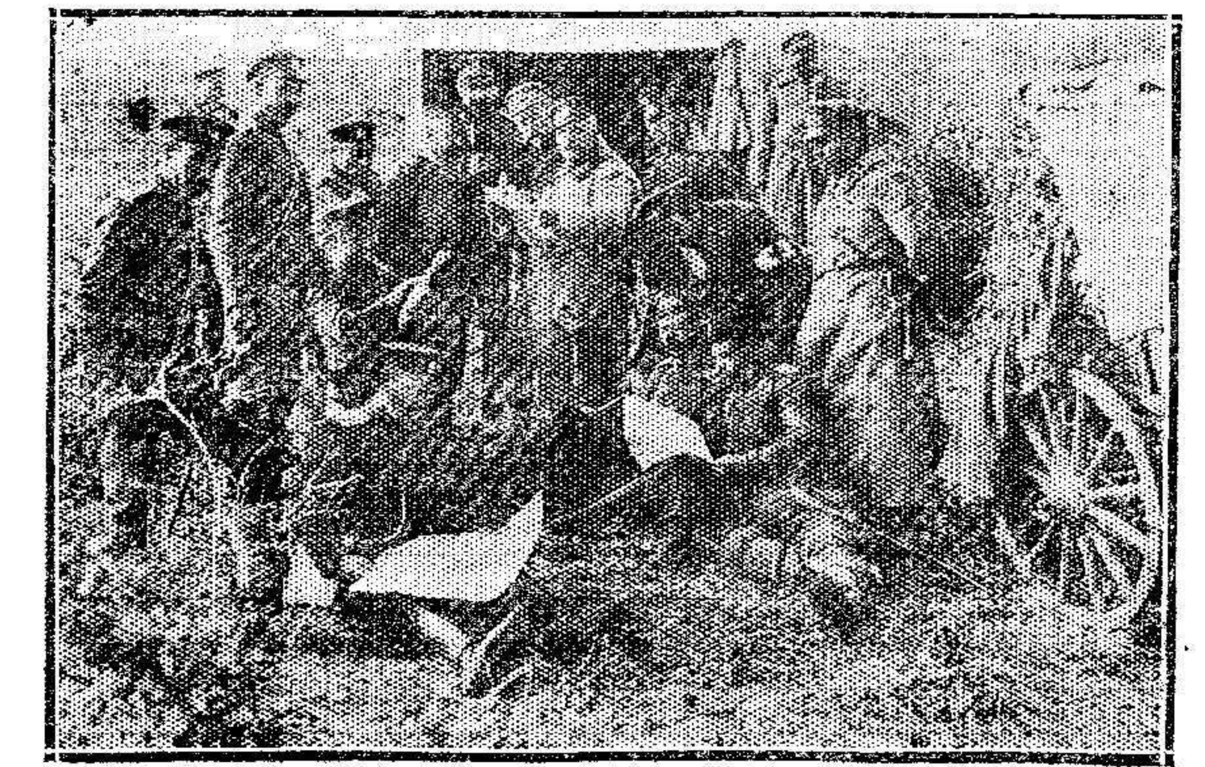
Oficiales servios en un vivac.