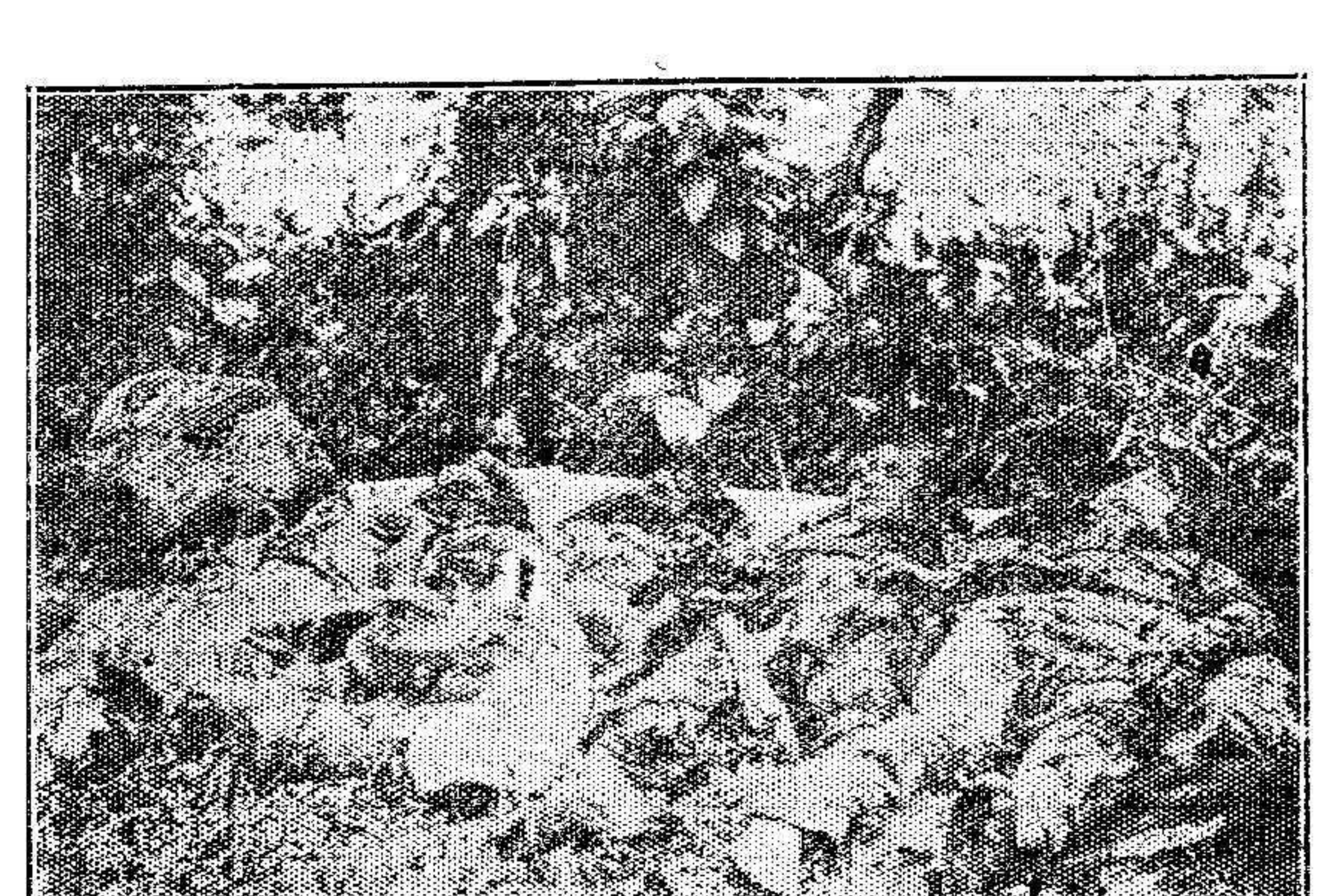
Las batallas de Francia después de la lucha.

Bardos.—El Gobierno ha desmentido terminantemente la noticia circulada por los alemanes referente a la retirada de los franceses de la línea del Aisne.