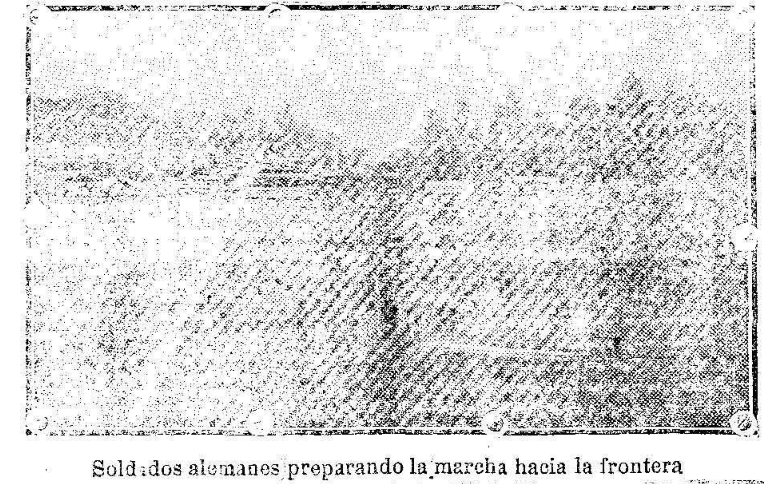
Soldados alemanes preparando la marcha hacia la frontera

LICORES DE TODAS CLASES Gran surtido en VINOS FINOS DE MESA ITALIANOS, ESTILO MARQUES DEL RIO AL, á pesetas 7.75 arroba y 60 céntimos litro 1265