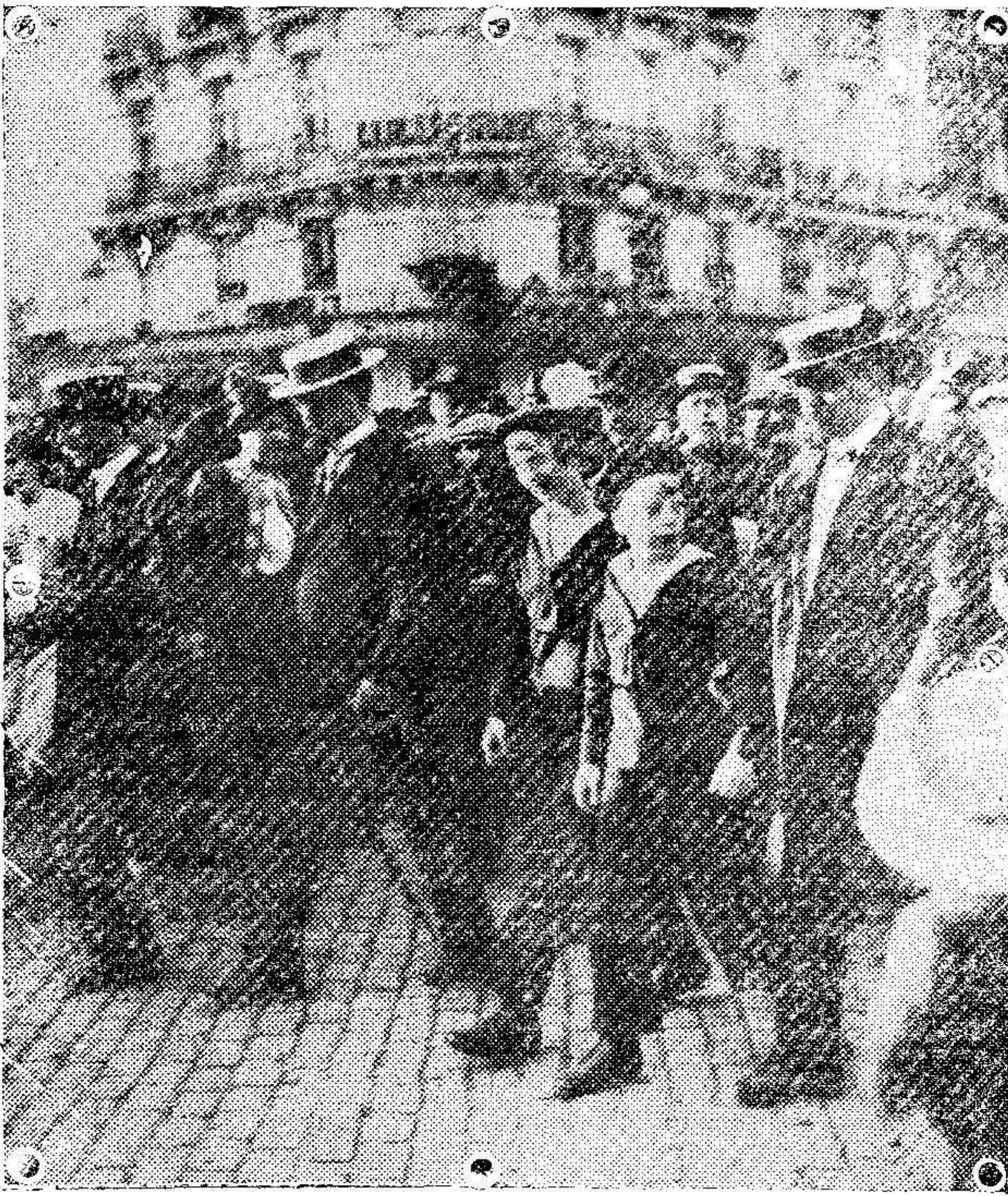
El Príncipe heredero de Bélgica y su hermano, seguidos de la multitud al pasar por las calles de Bruselas.