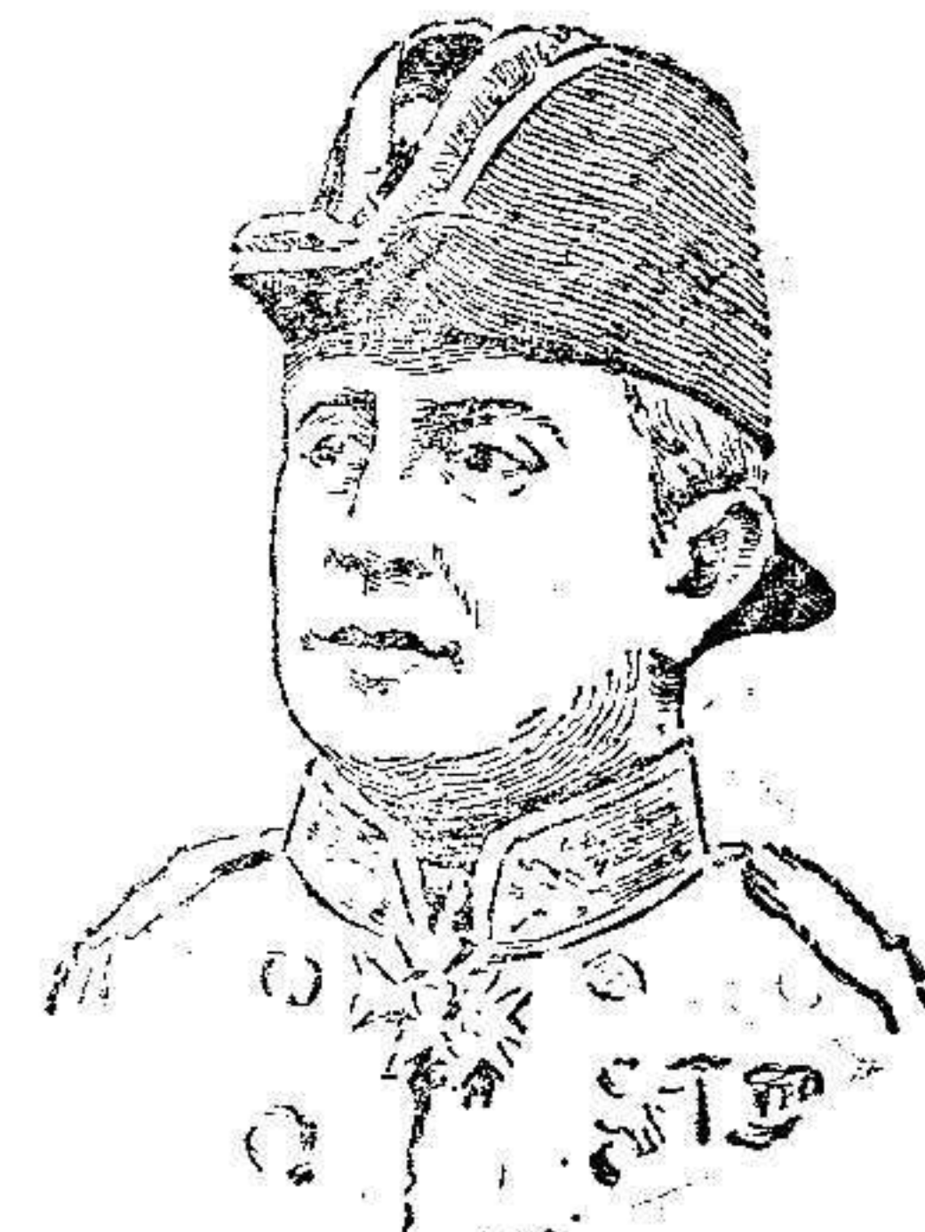
Sir G. A. Callaghan

Italia: Ocho dirigibles, 150 aeroplanos y 180 pilotos.