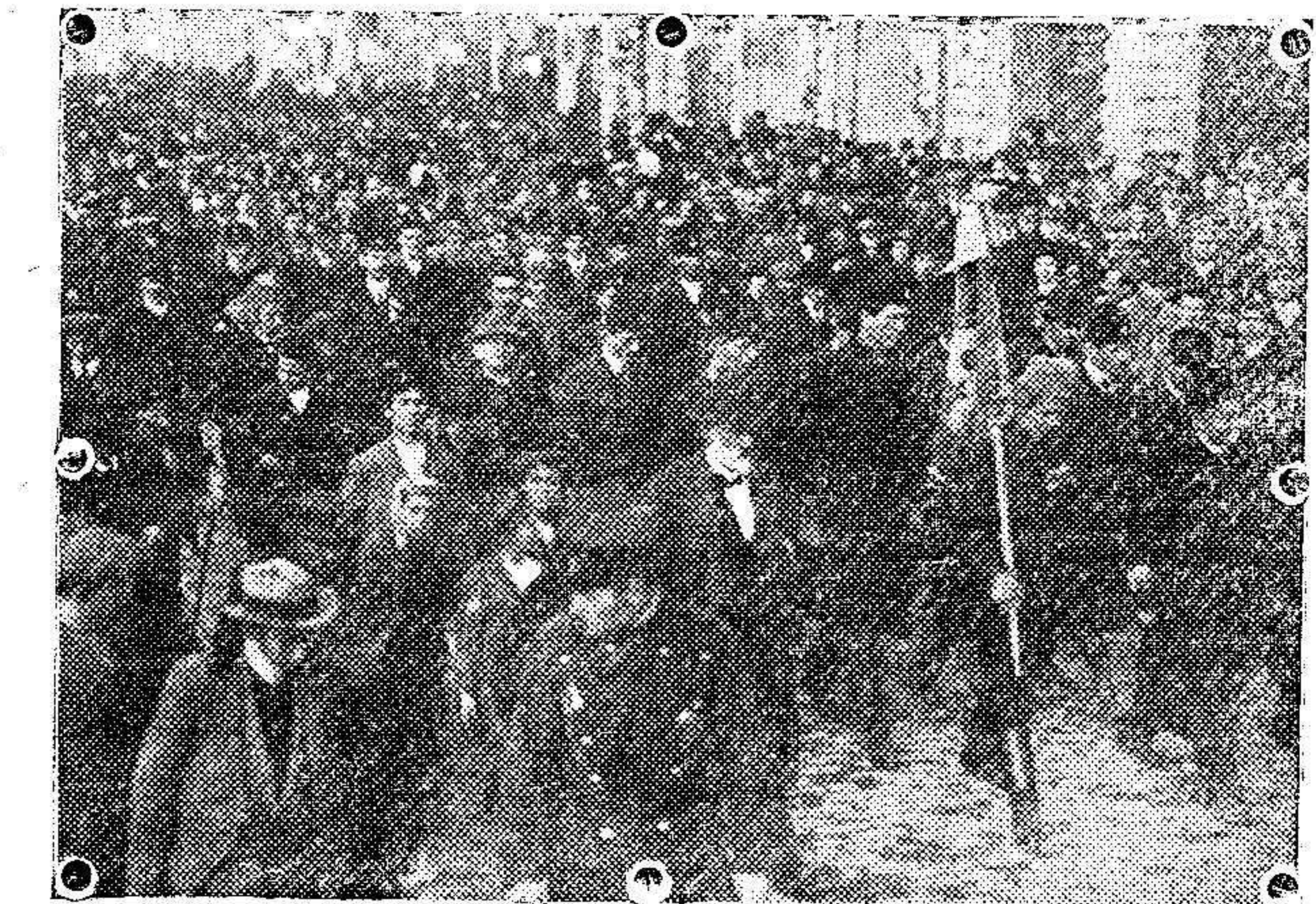
Una manifestación en favor de la guerra en Belgrado, veinticuatro horas antes de haberla declarado oficialmente Austria.

Un telegrama recibido en esta Sucursal de nuestro primer establecimiento de crédito, ordena que desde hoy el tipo de inte-