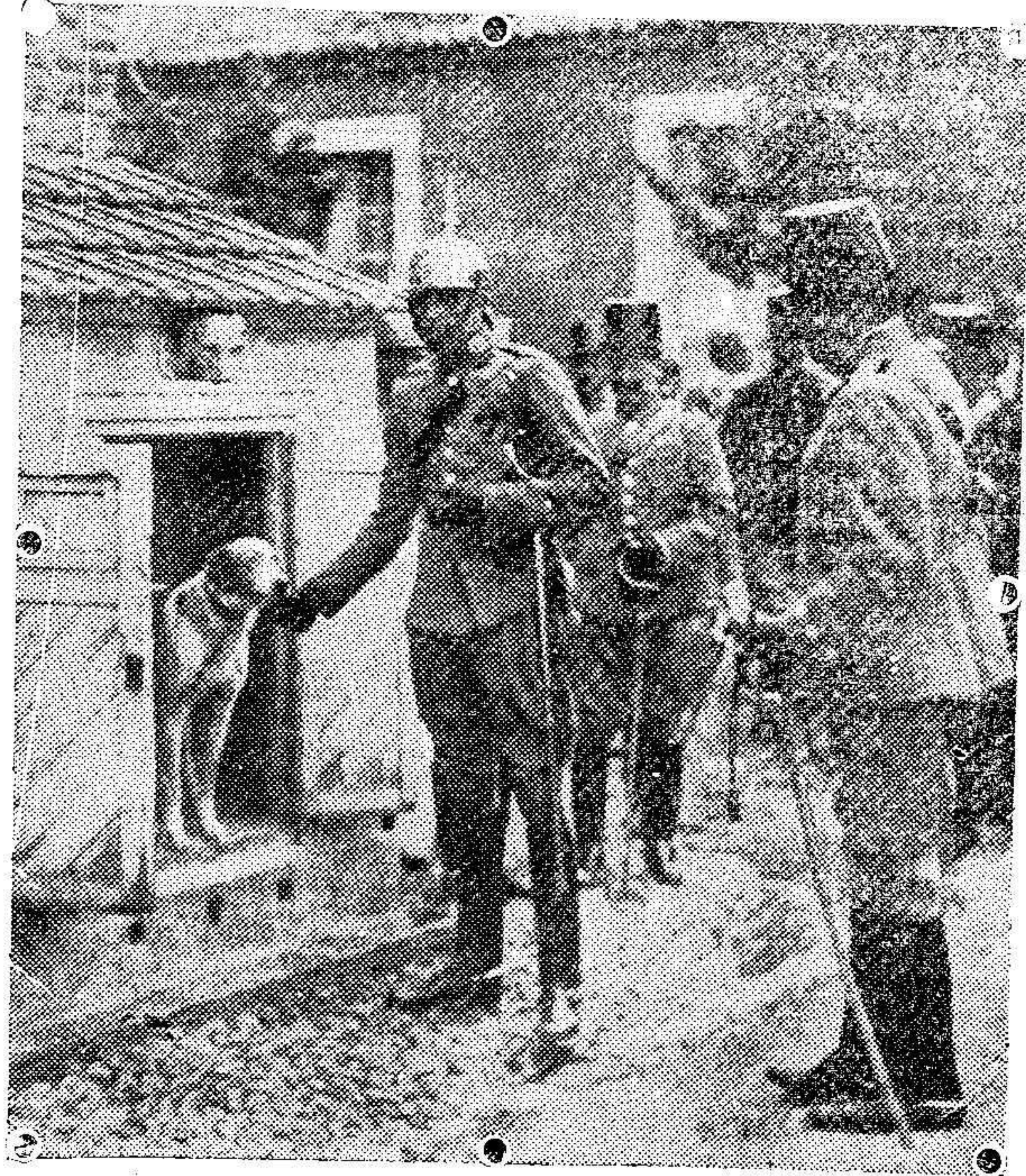
S. M. el Rey acariciando a uno de los perros exploradores que utilizan los alumnos de Caballería para sus prácticas.