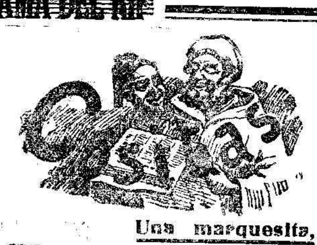
Una marquesita, bécica

Cubrecargas, Salacoff y Cantimploras de aluminio. Sastrería de Ricardo Fius PRIMAVERA 1914 Últimas novedades para caballeros: «Tailleurs» para señoras UNIFORMES MILITARES Alfonso XIII, 6, bajo y principal