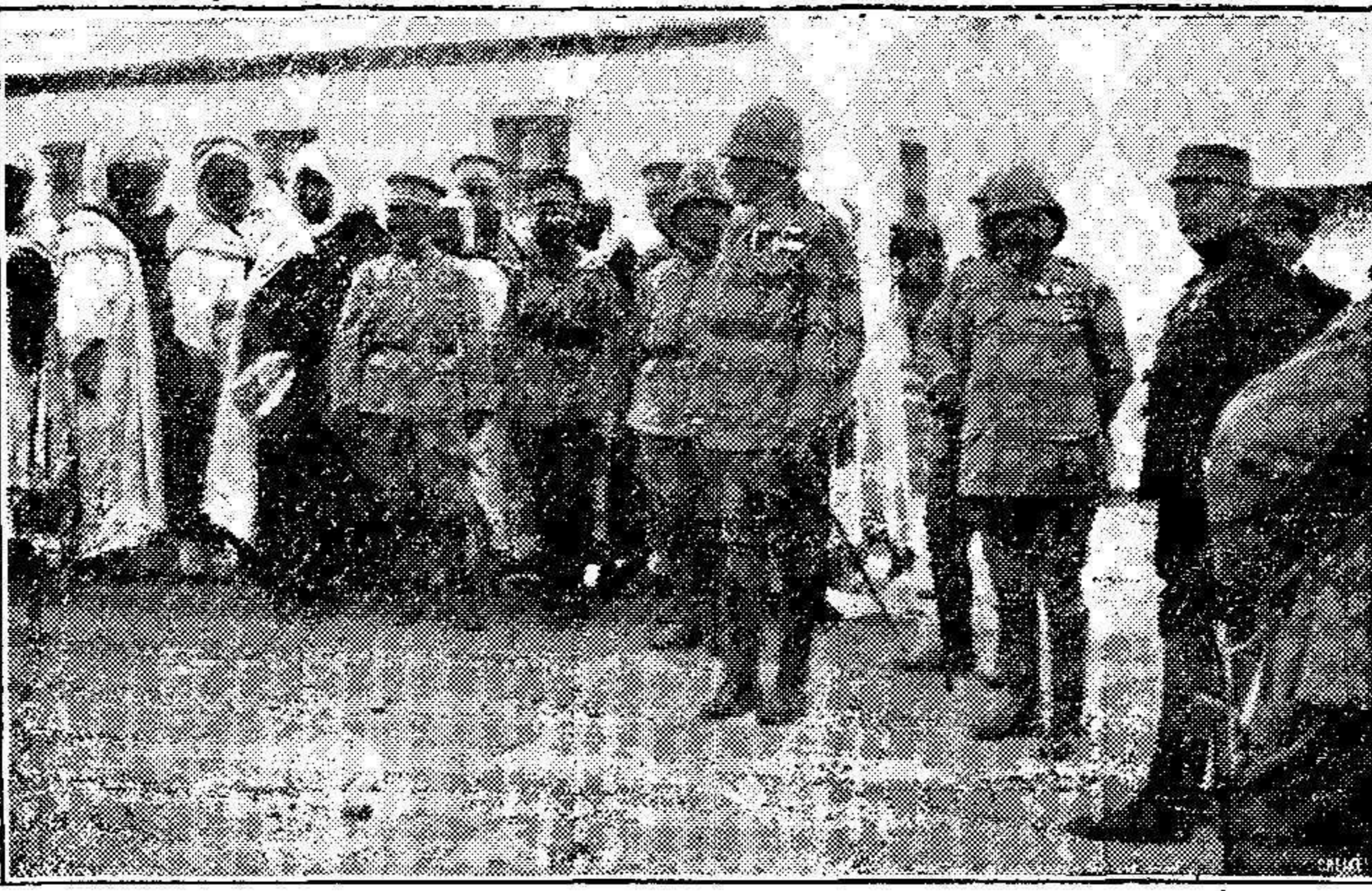
Los Generales Baumgarten y Jordana, hablando con los caídos del territorio.