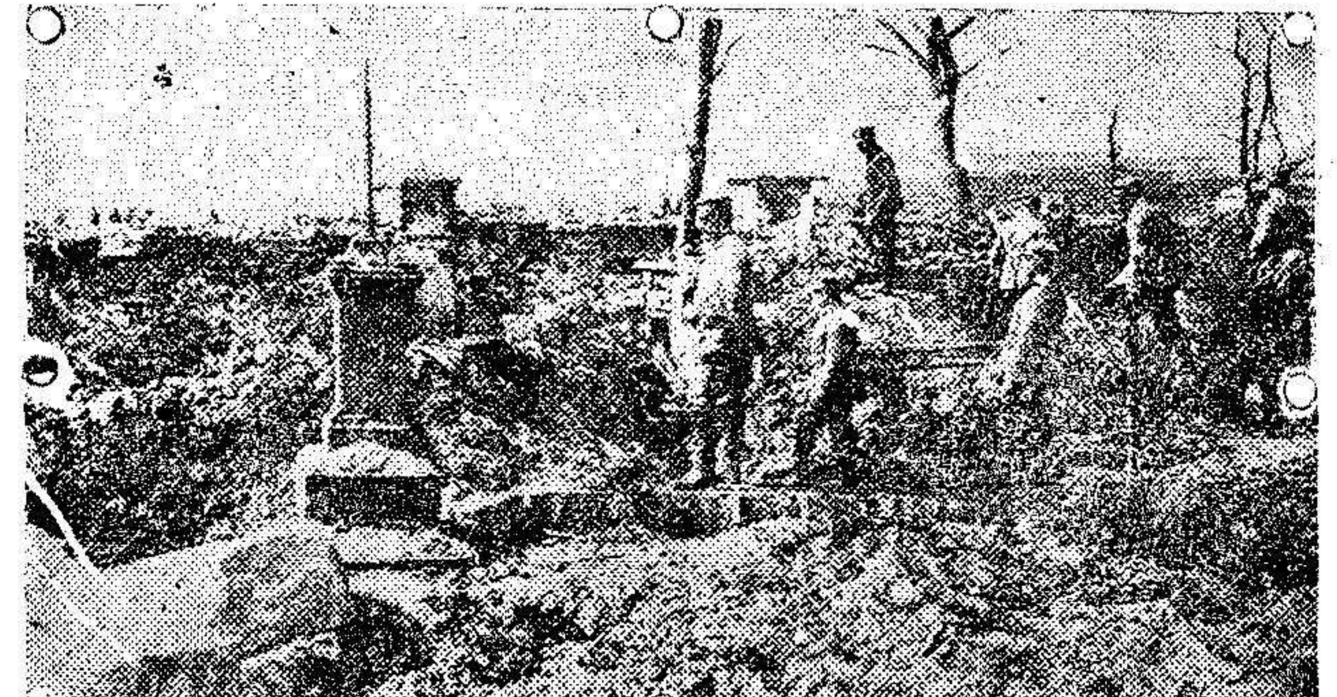
El cementerio de una aldea de Jacobdard (Carlandia), destruido por la artillería de los combatientes.

La esposa ha sido detenida y después de prestar declaración ante el Juzgado ingresó en la cárcel, quedando incomunicada.