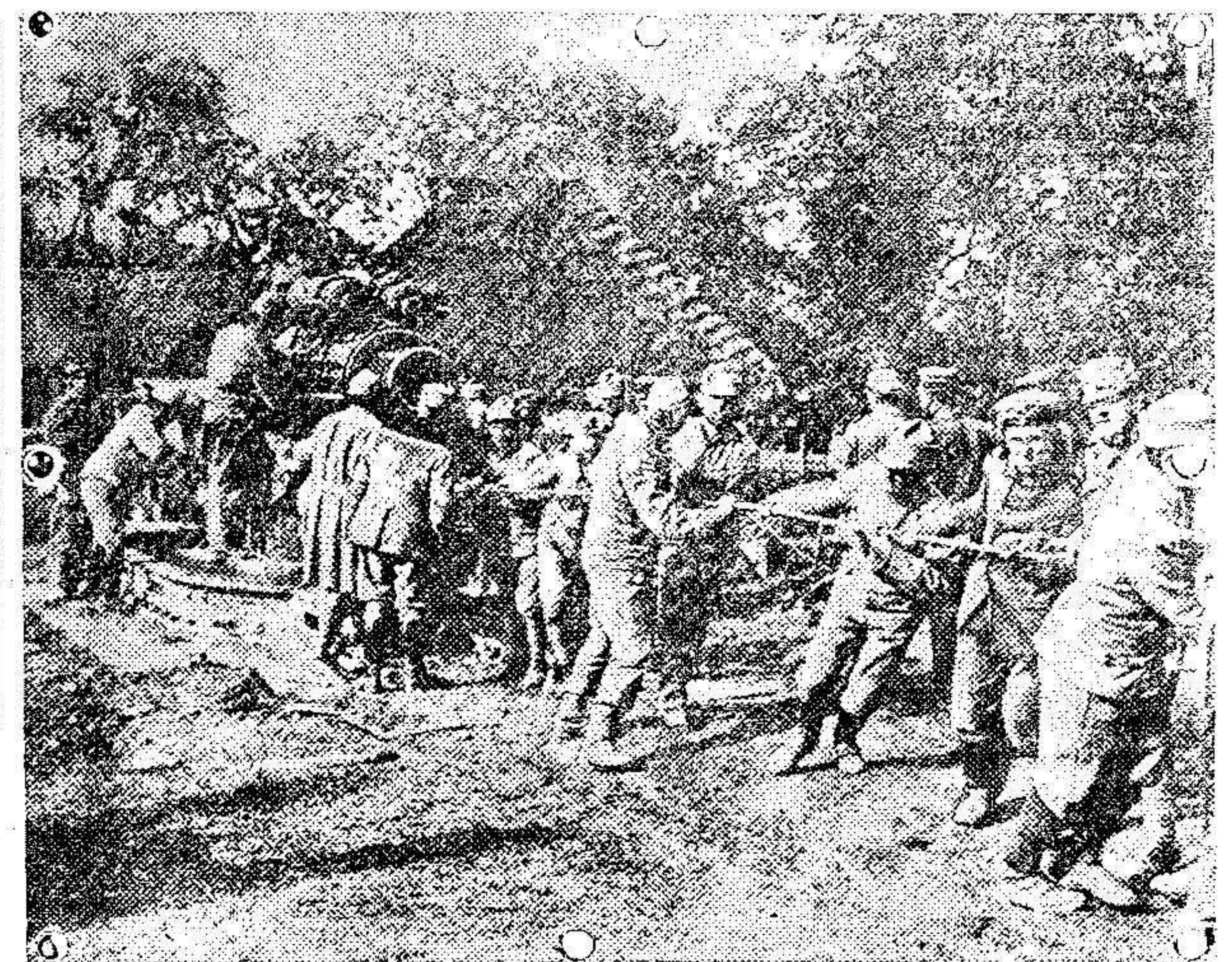
Colocación de un mortero de 55,8 frente a la línea de ataque de los italianos en el Trentino.