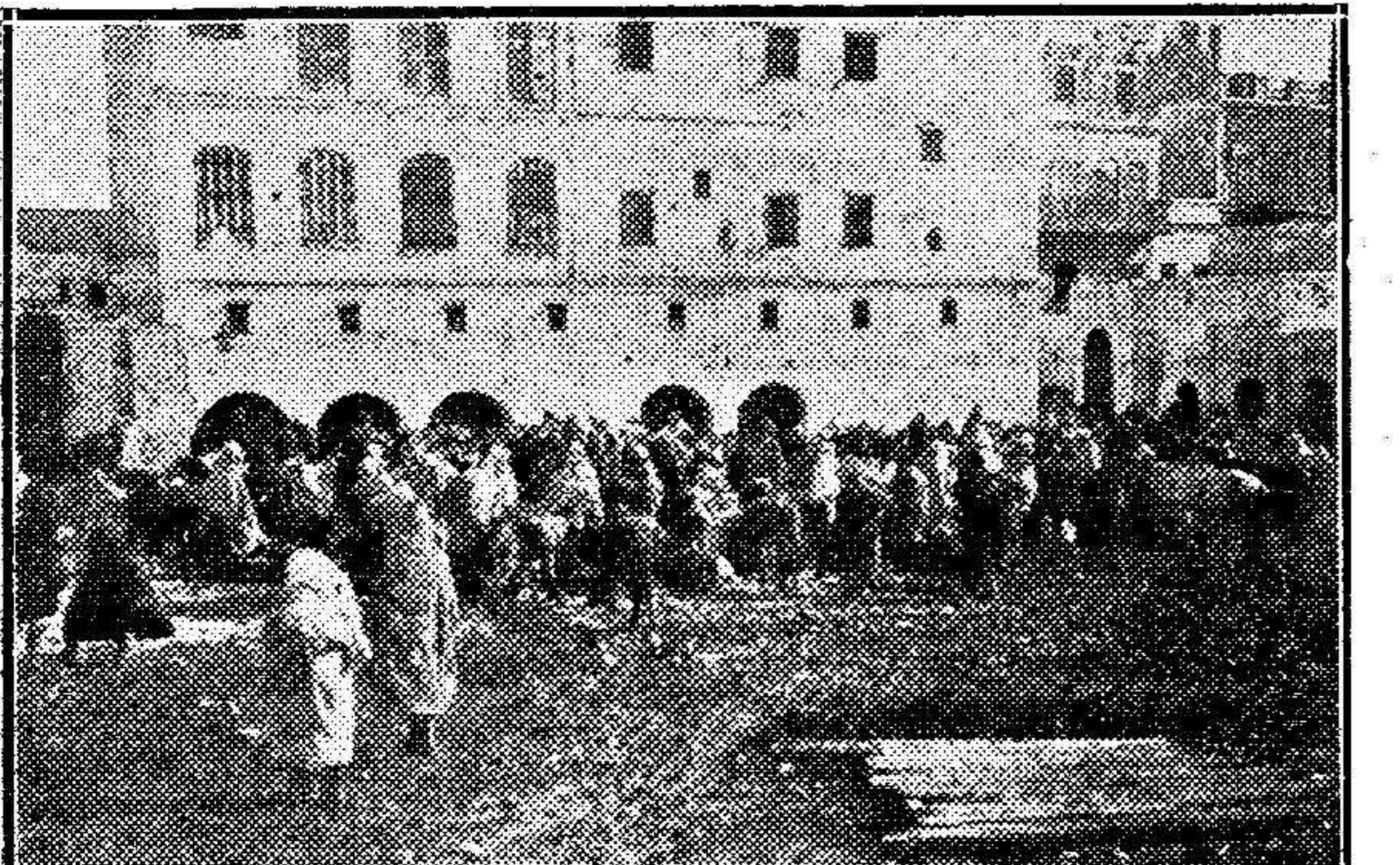
TETUAN.- El mercado de trigo