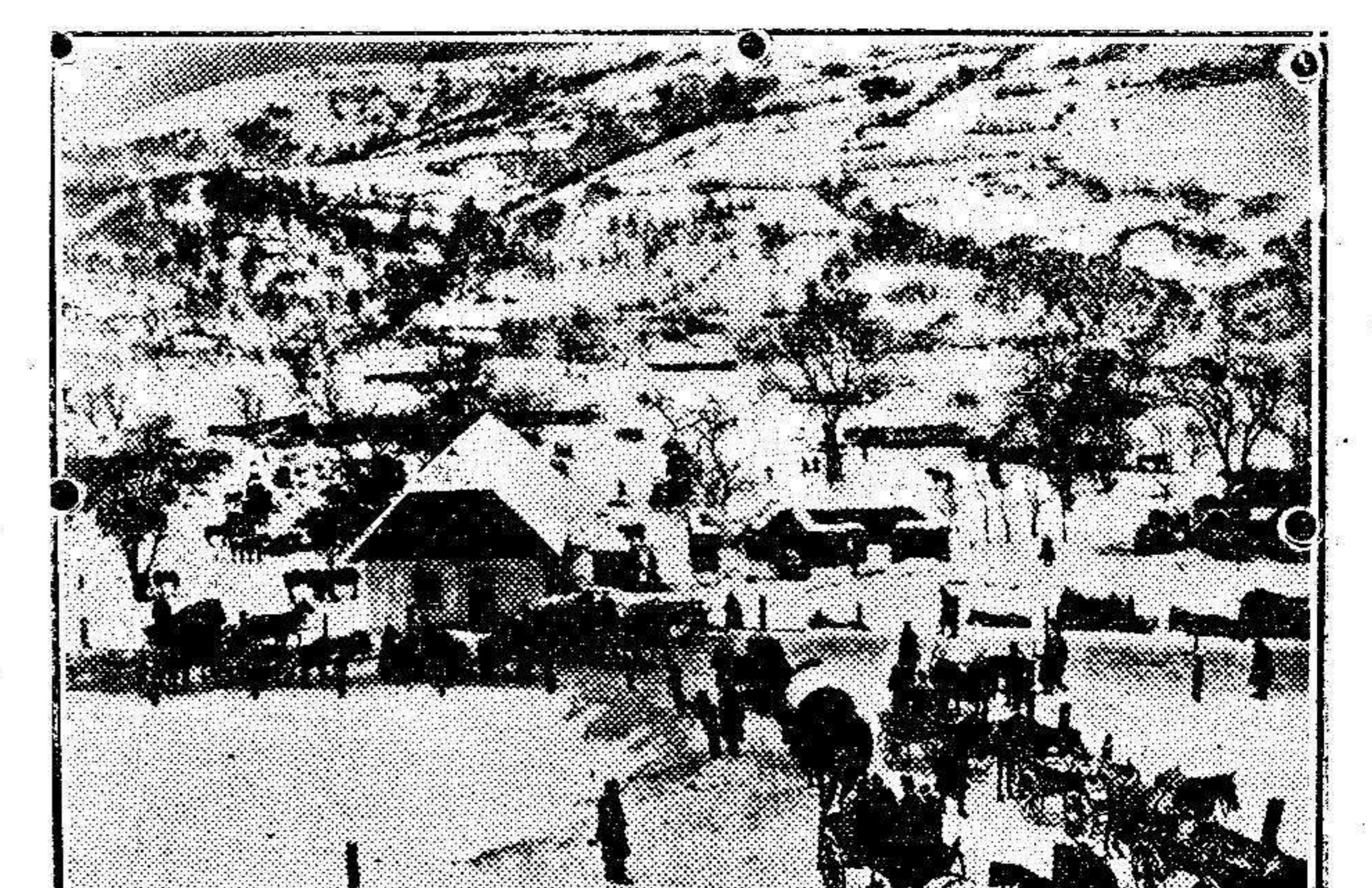
Columna austriaca de aprovisionamiento en las regiones nevadas de los Cárpatos.