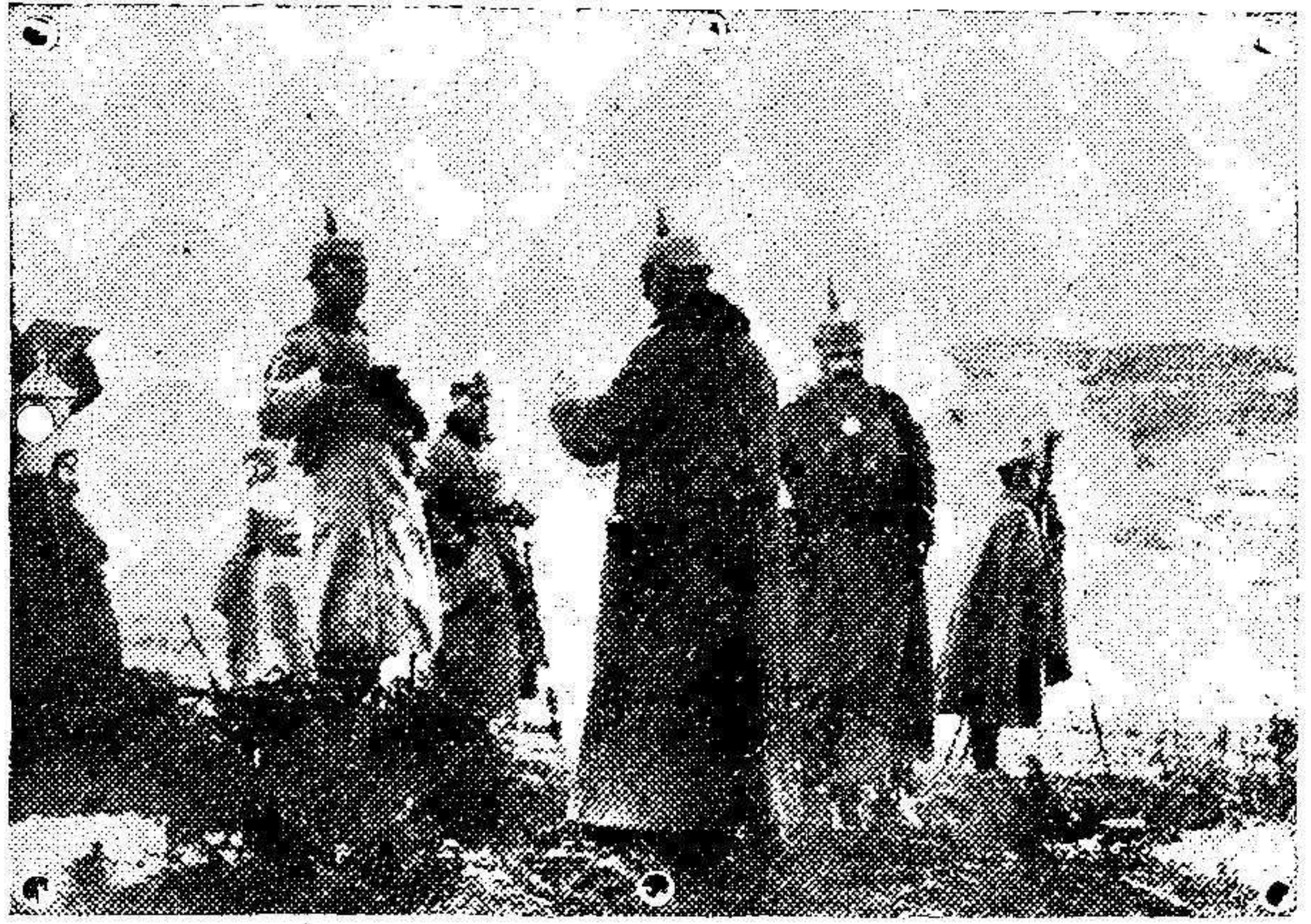
El Kaiser haciendo observaciones en la línea de fuego.

Hoy se abren nuevamente los comercios, cerrados desde el 25 de Marzo.