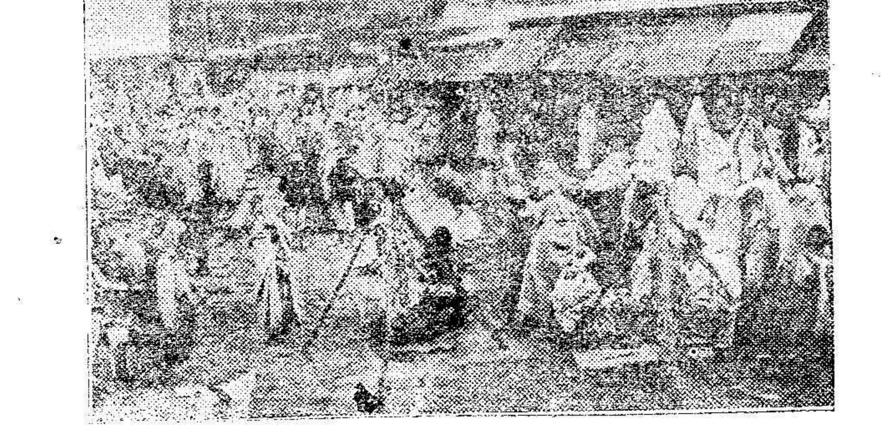
Alcazarquivir.—El zoco.—En primer término los puestos de carne.