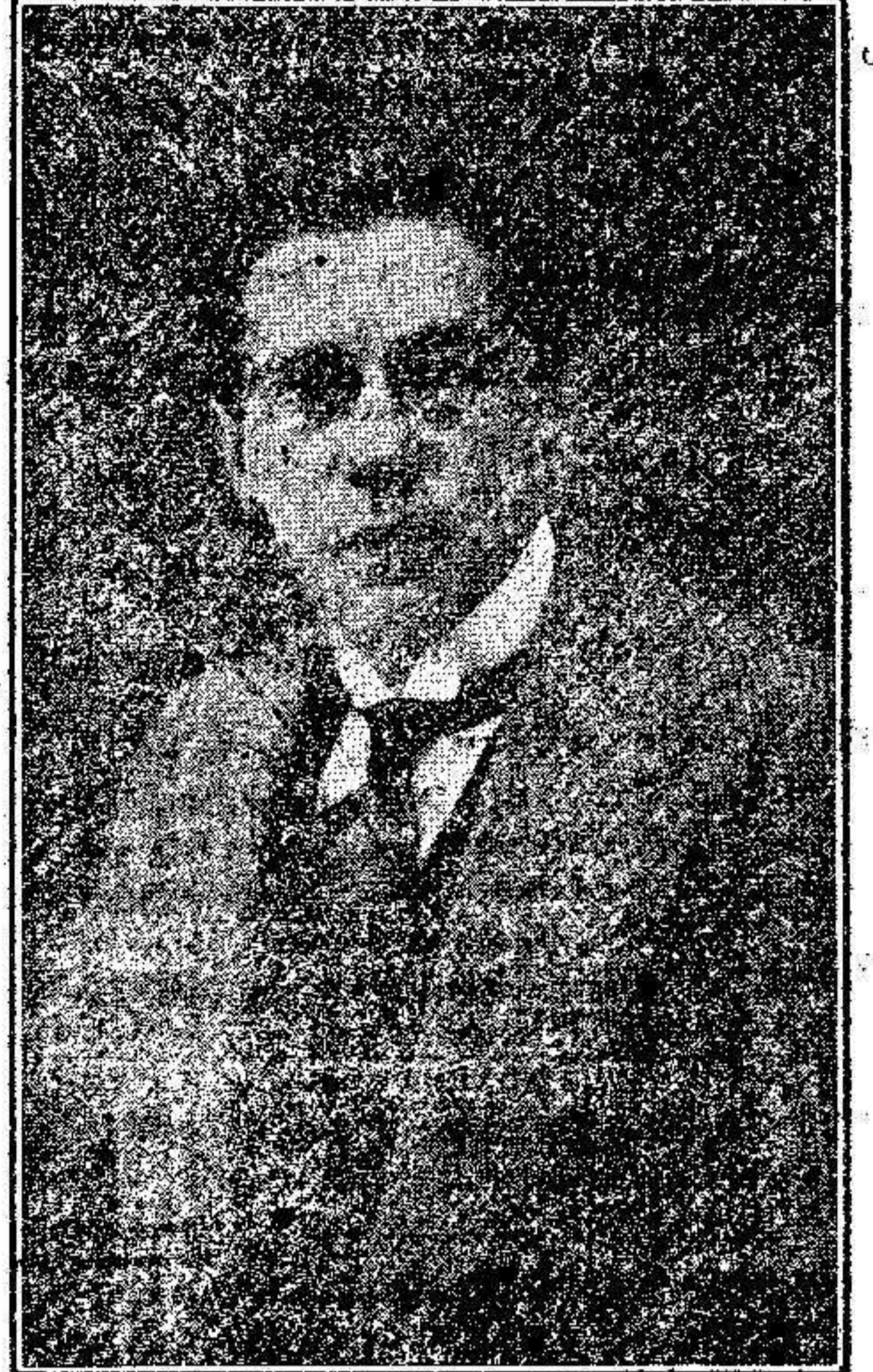
Poeta premiado con la flor natural