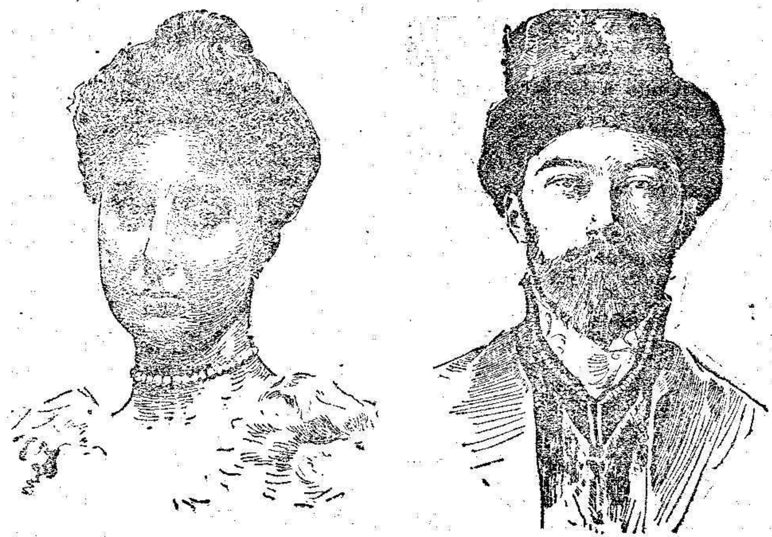
S. M. la Infanta María Teresa