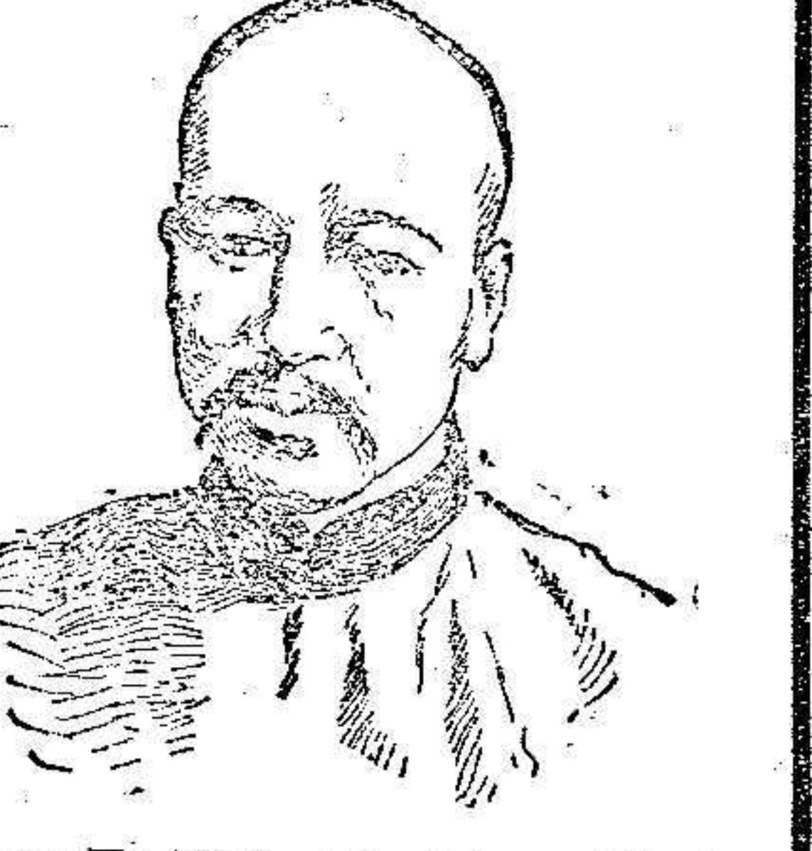
Kang-Yu-Wei, jefe del partido Kang-Yu-Wei, organizador y sostenedor de la revolución actual.