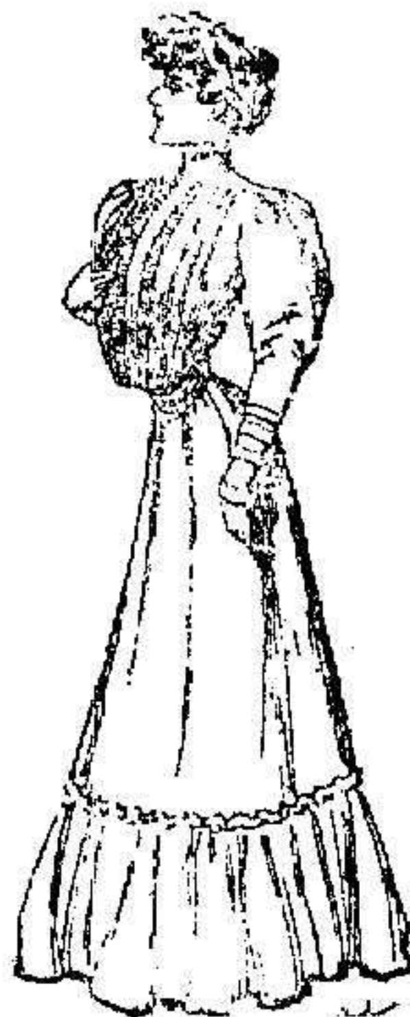
Vestido «Fany», para casa. Cuerpo bombeado, adornado por tiras de

puntilla, manga hueca; cinturón de seda.