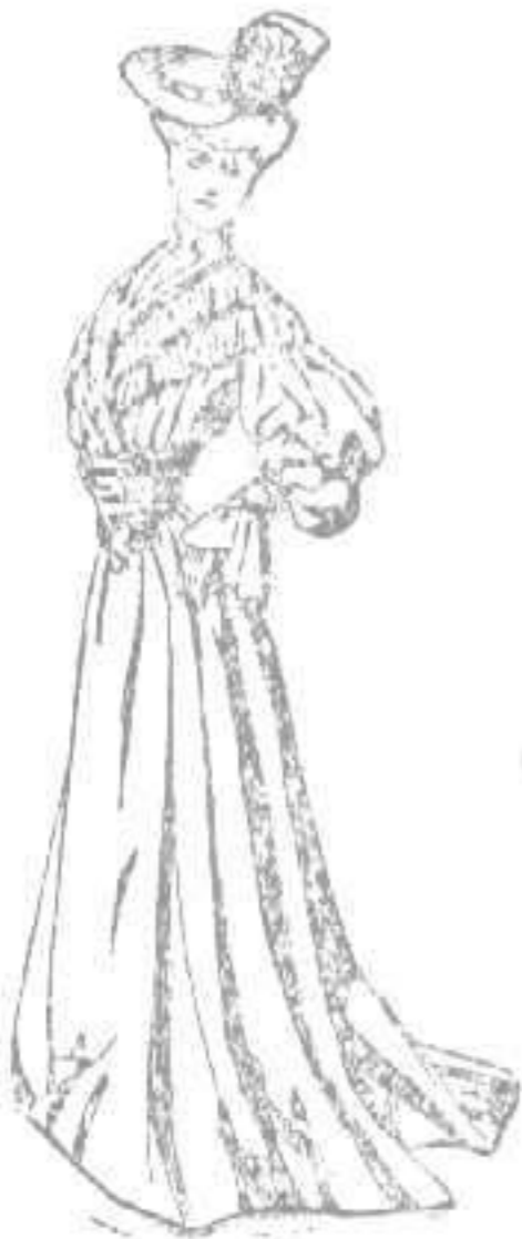
Trage para teatro

Elegante cuello, cerrado por lindo choux Pecherín de blonda, partido; otras dos en chas blondas cruzan el pecho. Cinturón amplio de seda. Mangas huecas terminadas por blondas, también, así como el final del puño. Falda á pliegues.