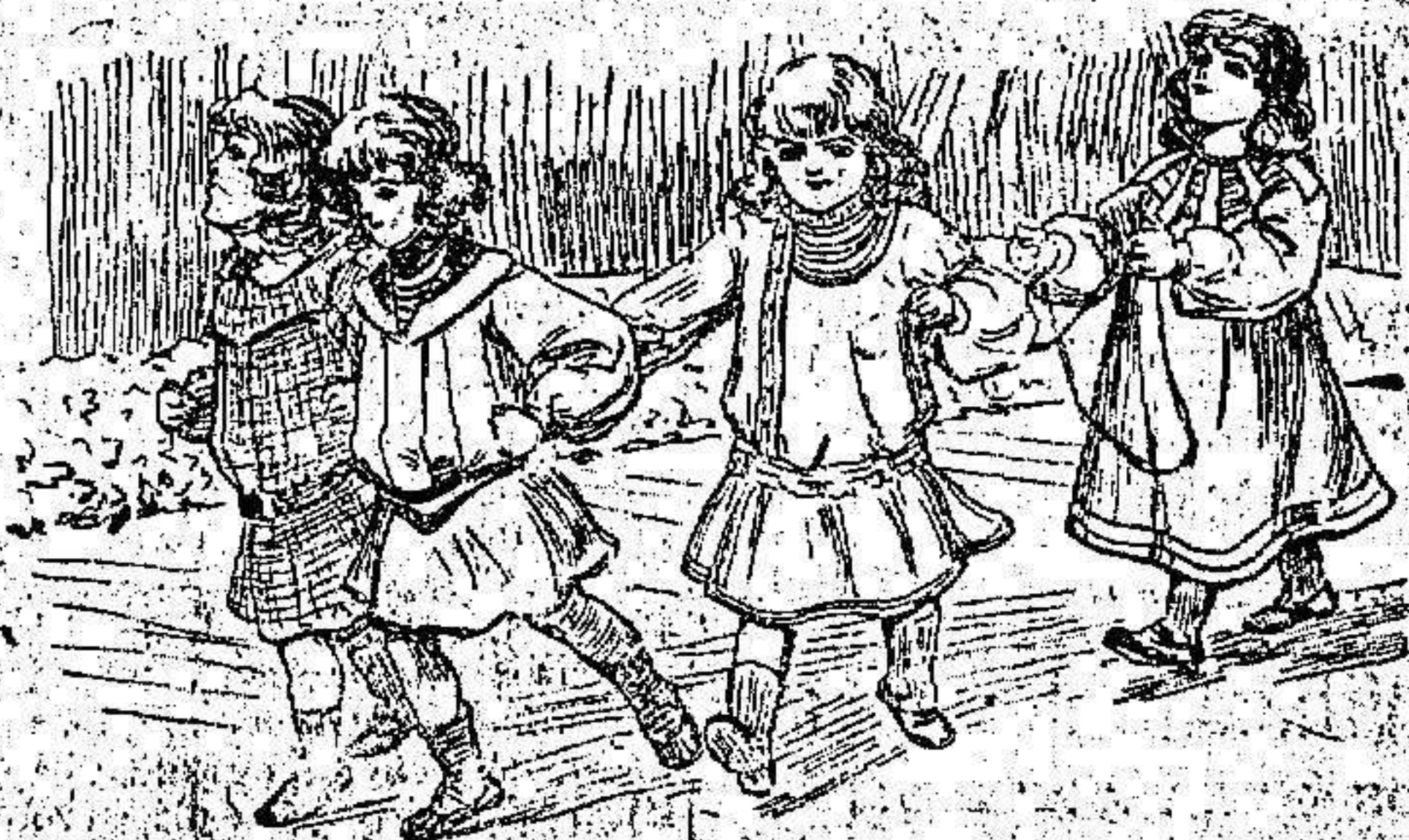
Trajecitos para niños y niñas

Cómodos y muy halagados. No precisa detallar ninguno de ellos ya que su construcción es en extremo sencilla y pueden hacerse de muy diferentes telas.