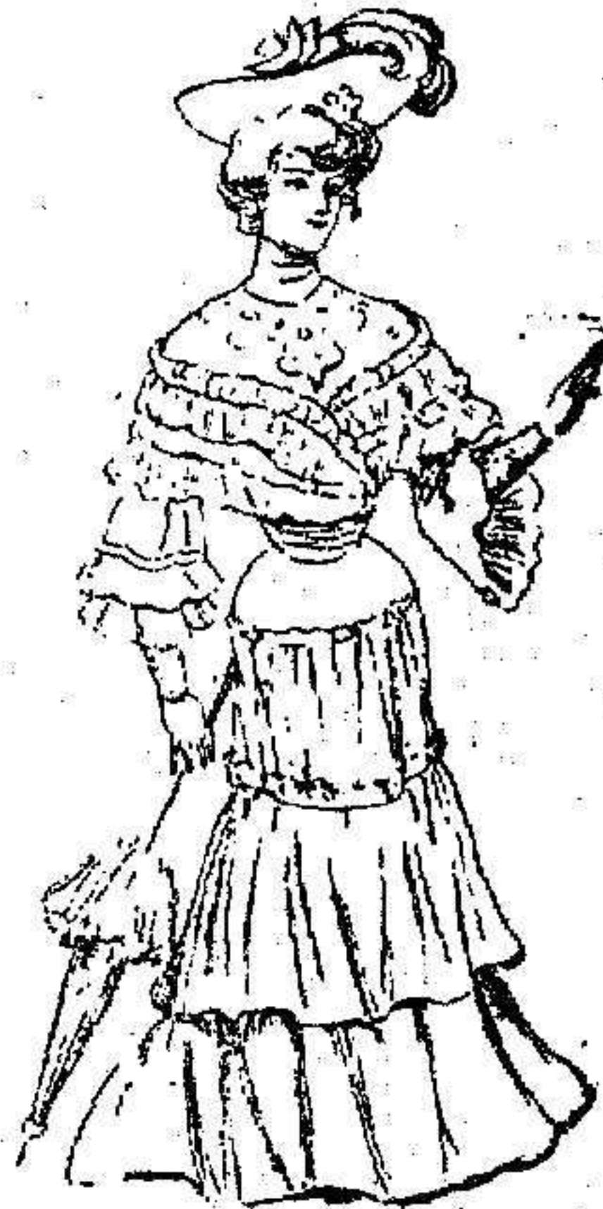
Vieloso traje de paseo

Compónese de elegante cuello valona, terminado por tres órdenes de volantes. Manga corta con puño, ó para mitón, también con dos volantes y un bias al filo.