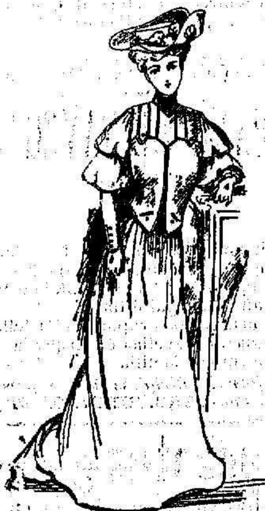
Trage de mañana

Chaqueta sastre tableada y lisa, abrochada por coches automáticos interiores. Cane-